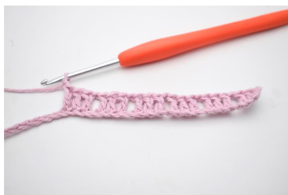
6. Gentag "til" i alt 5 gange.