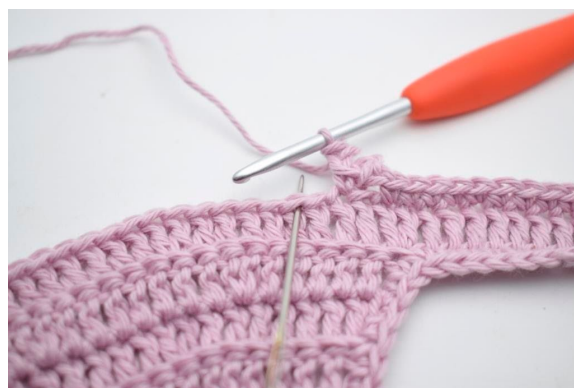
12. Hækl 1 fm i næste m.