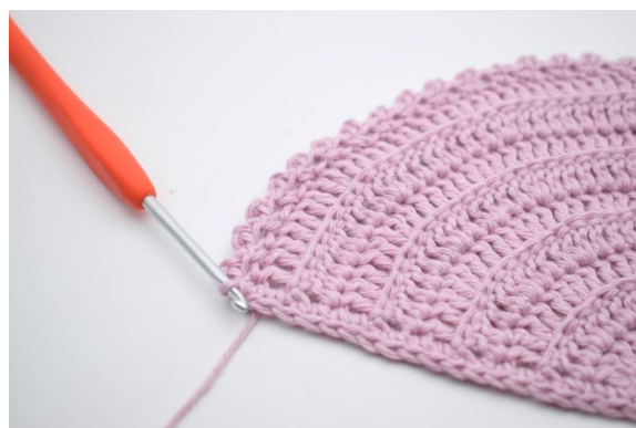
14. "Lav 2 lm, hækl 1 km i 2. lm fra nålen, spring 1 m over og hækl 1 fm i næste m". Gentag "til" omgangen ud og afslut med 1 km i første m.