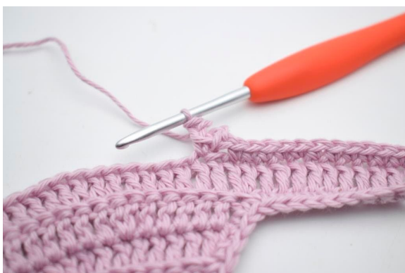
11. Spring 1 m over.