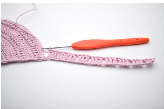
7. Lav 1 lm, spring 1 lm over og hækl 1 stgm i de sidste 9 lm.