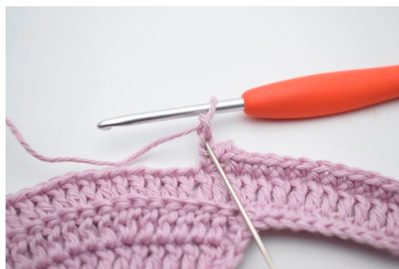
10. Hækl 1 km i 2. lm fra nålen.