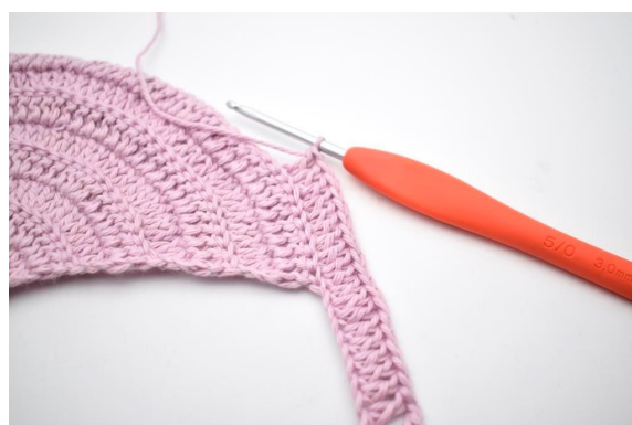
8. Nu hækles der i bml. "Hækl 2 stgm i næste m, 1 stgm i de efterfølgende 8 m".