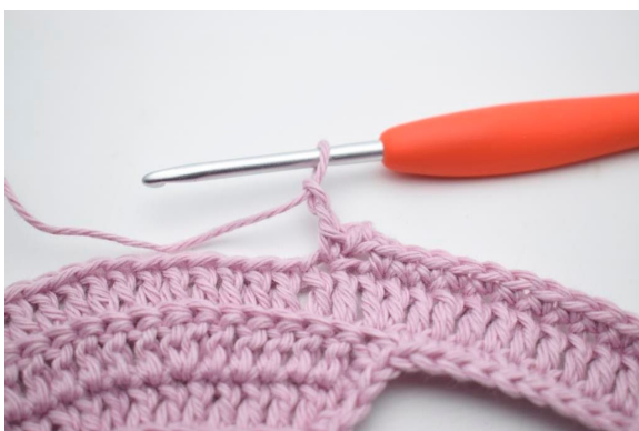
9. Lav 2 lm.