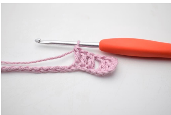
5. "Lav 1 lm, spring 1 lm over og hækl 1 stgm i de næste 3 lm".