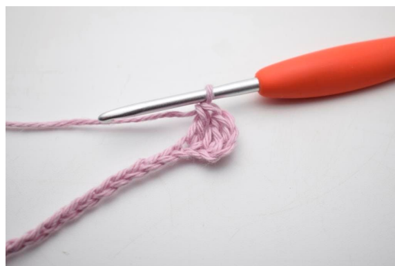
4. Hækl 1 stgm i næste lm.