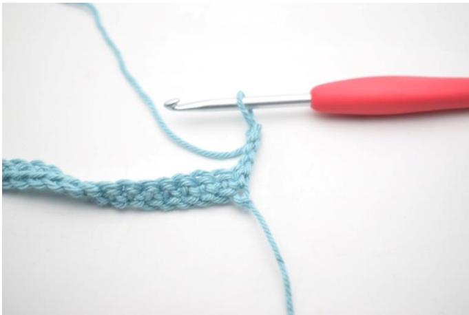
5. Vend med 4 lm.