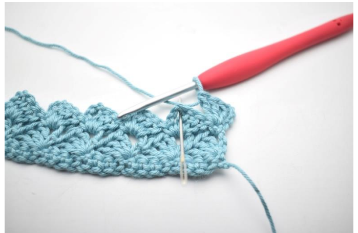
28. "Hækl 1 fm, 3 lm og 3 stgm i næste lm-bue".