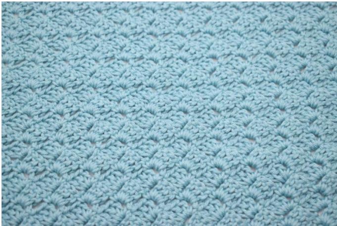
33. Gentag fremgangsmåden som række 3 til du har i alt 37 rækker.