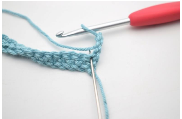
6. Hækl 3 stgm i første m.