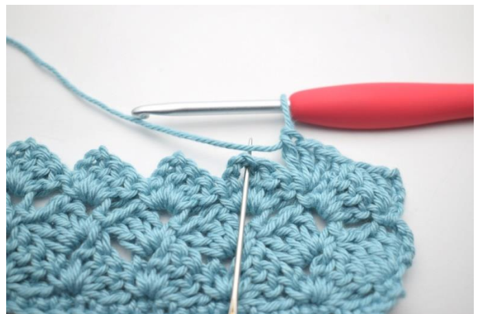
41. "Hækl 1 fm i næste lm-bue.