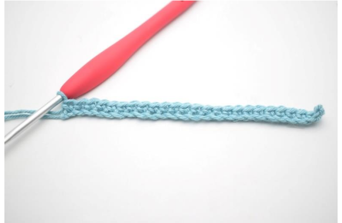
4. Hækl fm rækken ud.