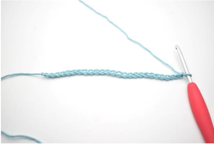
1. Slå 74 lm op.