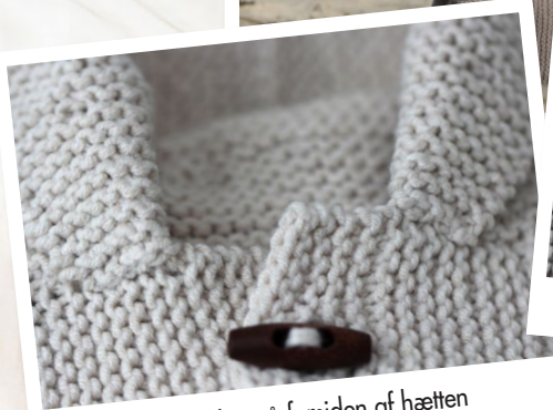
Ombukket på forsiden af hæften