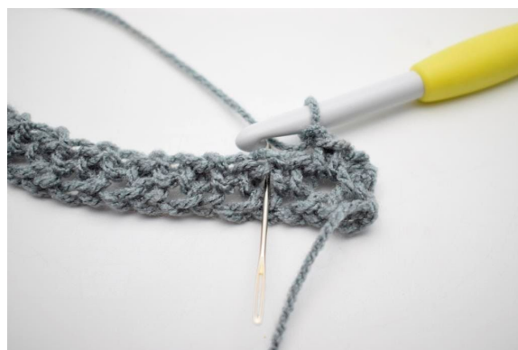
4. "Lav 1 lm og hækl 1 fm i næste lm-mellemrum".