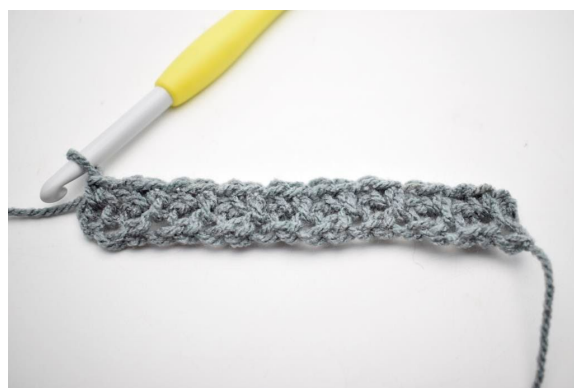
8. Gentag "til" rækken ud.