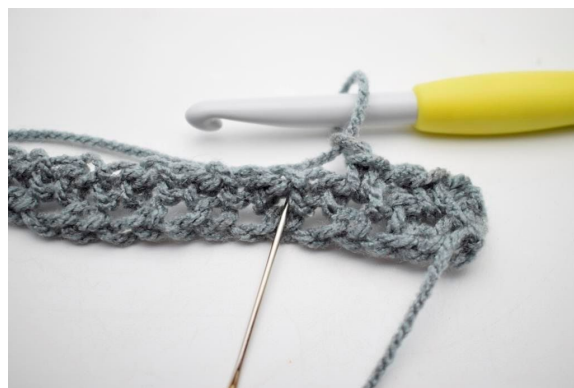
6. "Lav 1 lm og hækl 1 fm i næste lm-mellemrum".