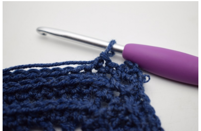
8. "Hækl 1 fm i næste m.