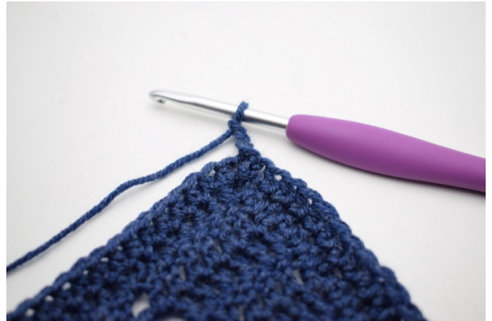
2. Lav 3 lm.