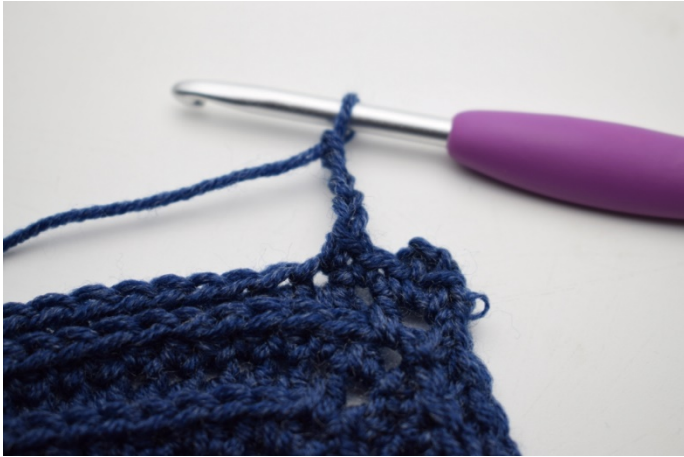
9. Lav 4 lm.