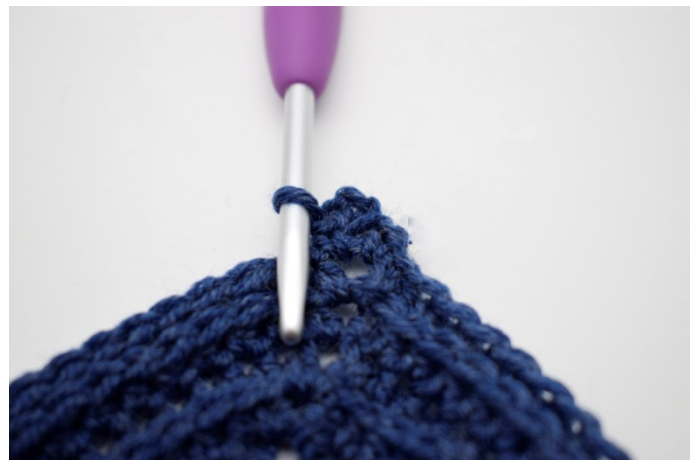
6. Hækl 1 fm i lm-buen.