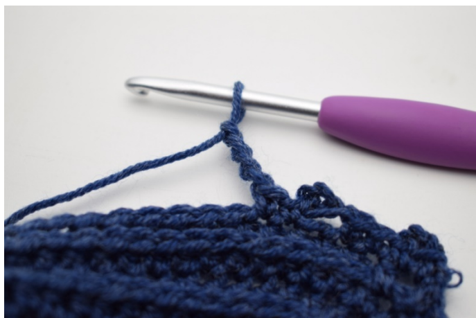
15. Lav 4 lm.