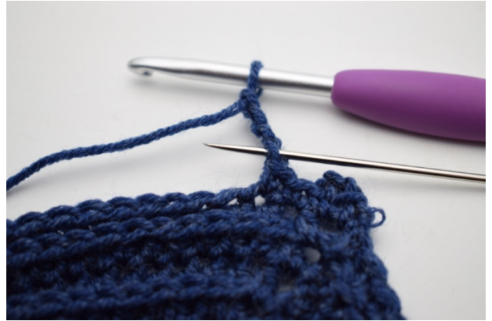
10. Hækl 1 km i 1. lm.