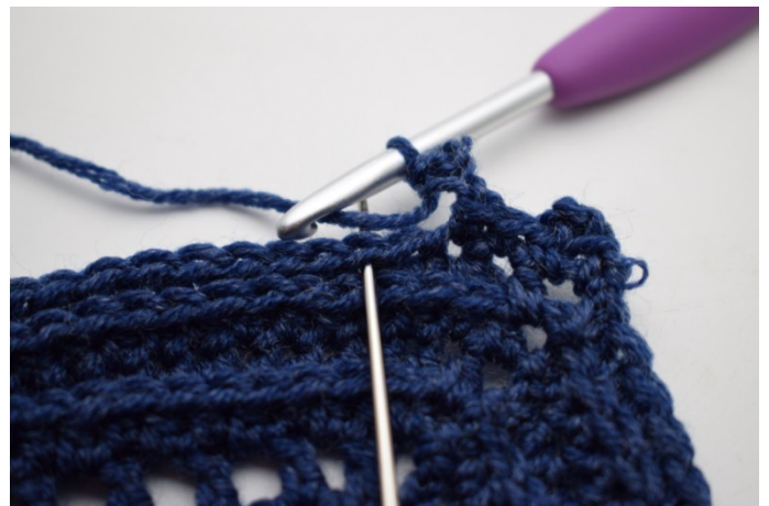
12. Spring 1 m over og hækl 1 fm i næste m".