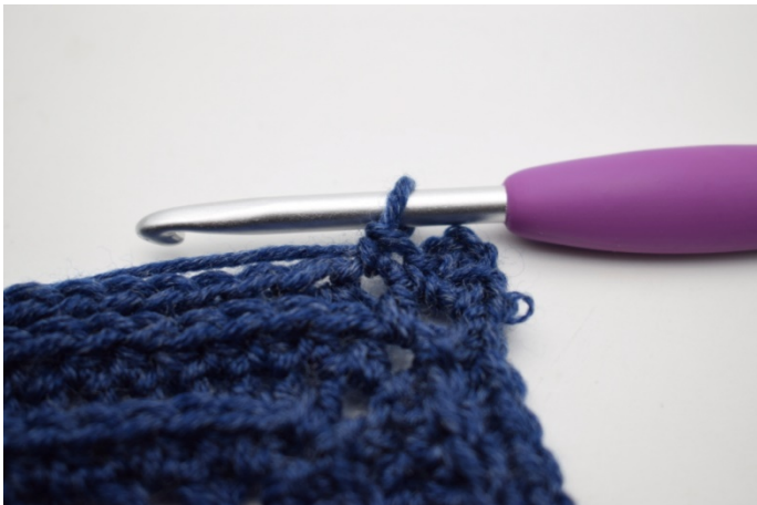
7. (Hækl 1 fm i første m.