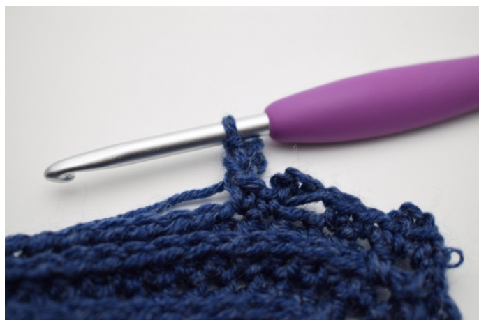
16. Hækl 1 km i 1. lm.