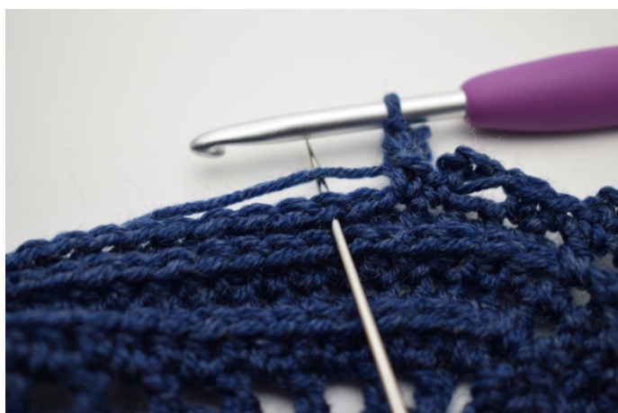
17. Spring 1 m over og hækl 1 fm i næste m".