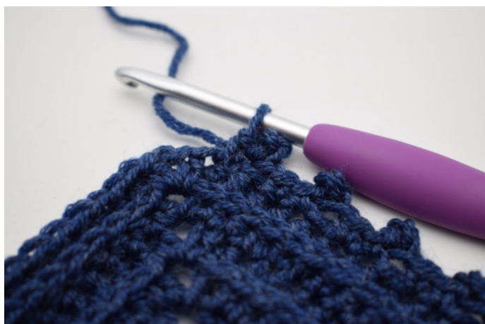
Gentag "til" i alt 59 gange.