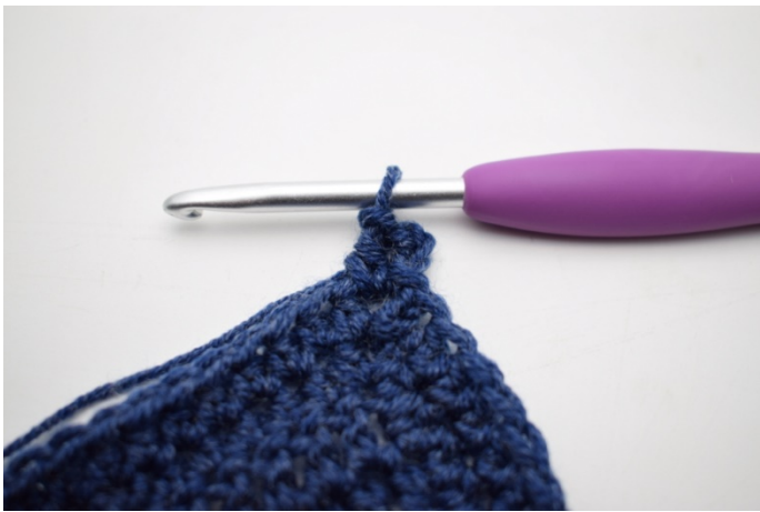
3. Hækl 1 hstm i lm-buen.