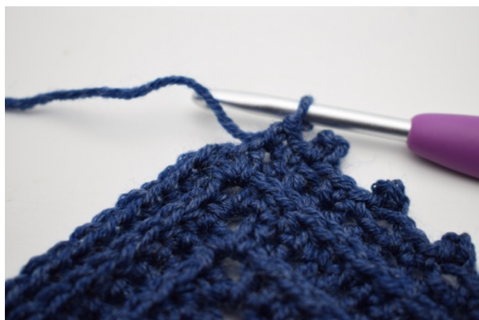
19. Hækl 1 fm i sidste m.