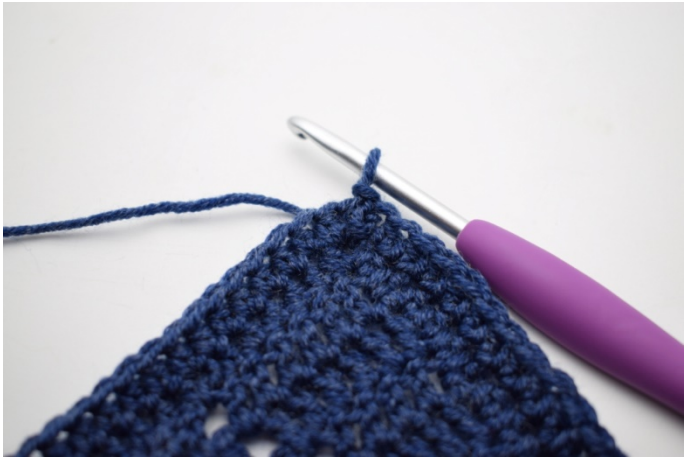
1. Lav 1 km omkring lm-buen.