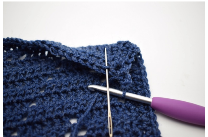
4. Hækl hstm i n-bml. Det er lænken bag dine 2 normale maskelænker som sidder nederst bagpå dit arbejde. Nålen her markerer den lænke der skal hækles 1 hstm i.