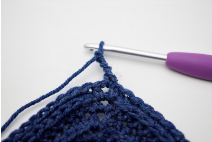
3. Lav 4 lm.