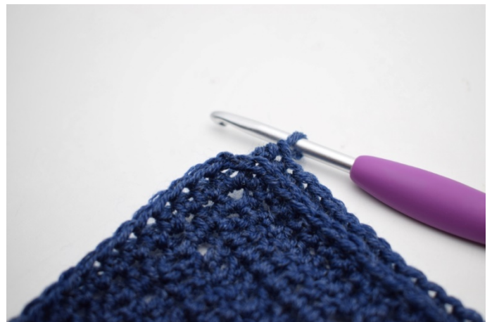
6. "Hækl 1 hstm i n-bml i de alle 161 m frem til hjørnet.