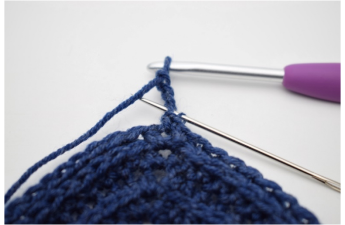
4. Hækl 1 km i 1. lm.