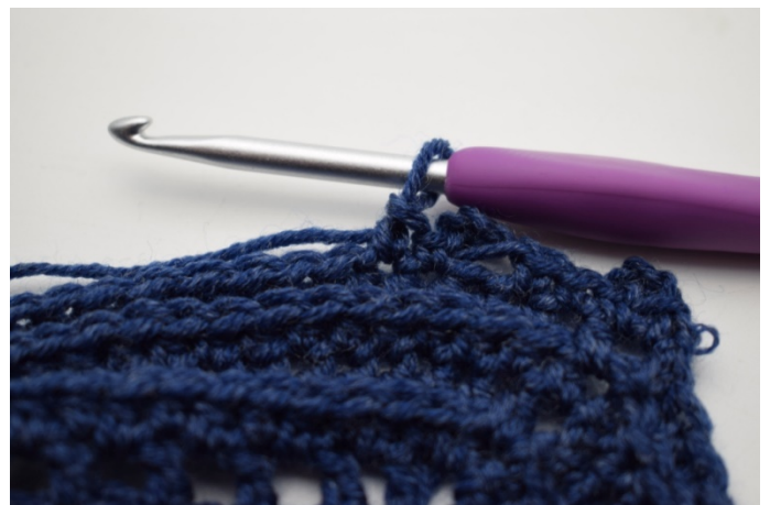
14. "Hækl 1 fm i næste m.