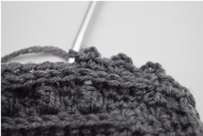
5. Gentag "til" omgangen rundt.