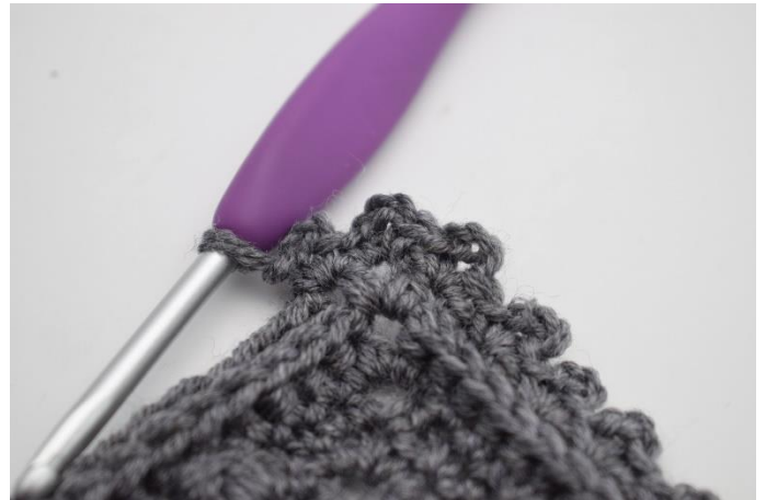
6. I hvert hjørne hækles 1 fm, 3 lm og 1 fm.