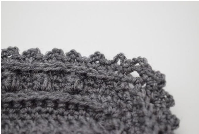
7. Afslut med 1 km.