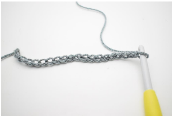
1. Slå 196 lm op.