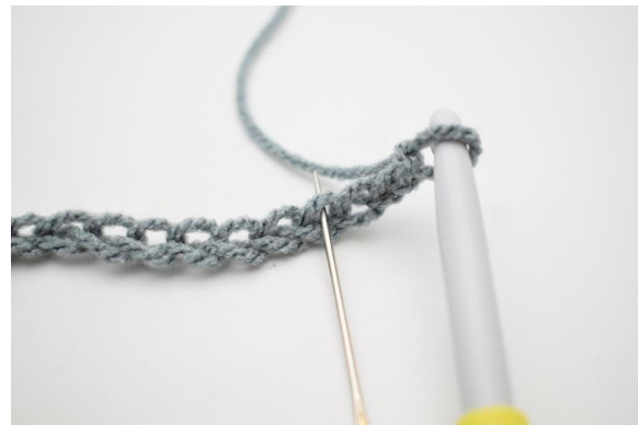
2. Hæk 1 fm i 4. lm fra nålen.