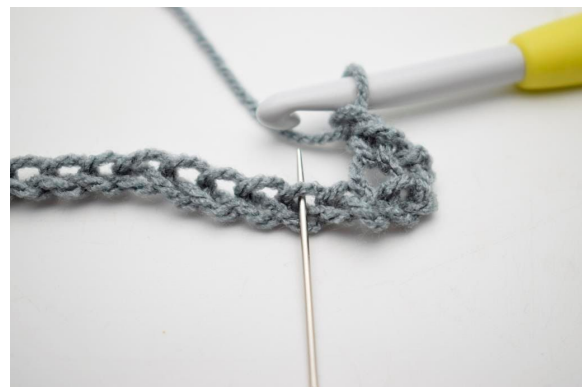
4. ”Lav 1 lm, spring 1 lm over og hæk 1 fm i næste m”.