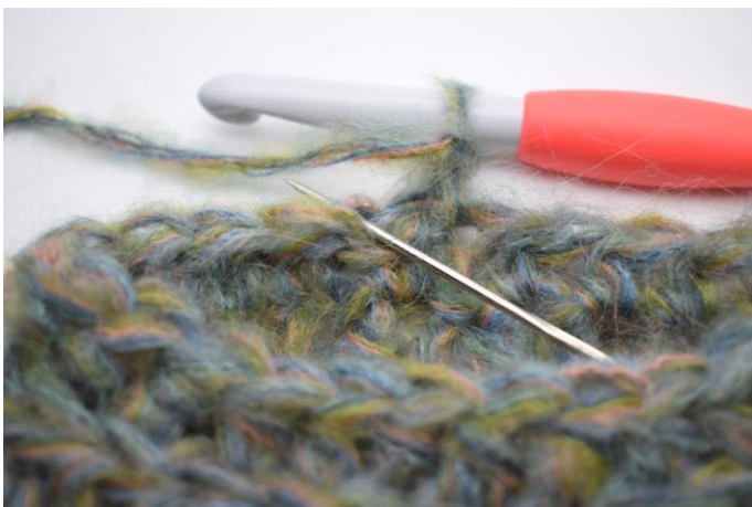
14. Hækl hstm i bml i første m.