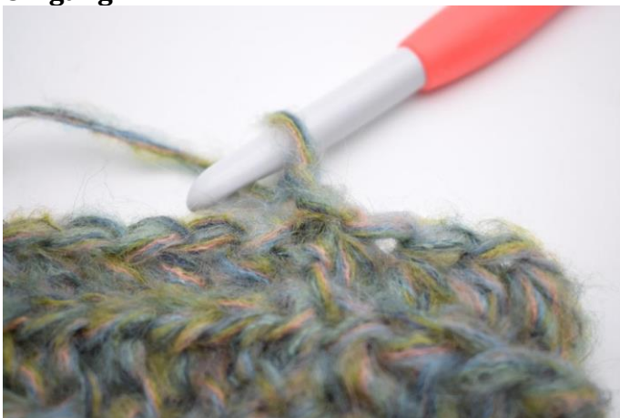
12. Denne omgang hækles som omgang 3. Lav 1 lm.