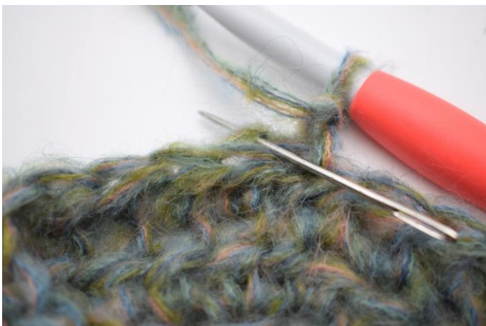
9. Hækl hstm i bml i første m.