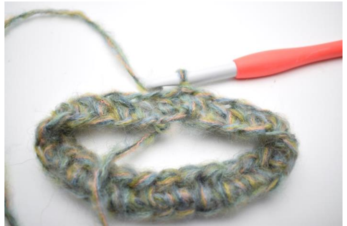
2. Lav 1 lm. Hækl hstm rundt i alle lm. Afslut med 1 km i første hstm. (58)