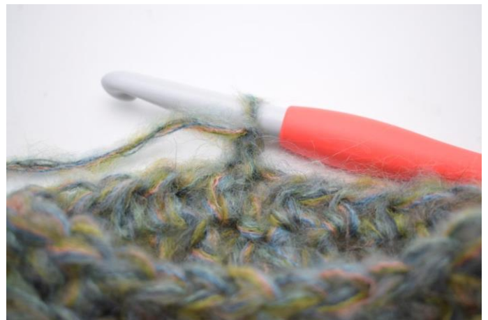
13. Vend arbejdet.