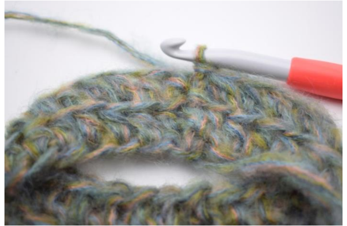
6. Hækl hstm i bml omgangen rundt. Afslut med 1 km i første hstm. (58)