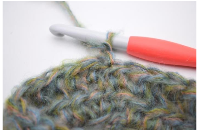
8. Vend arbejdet.