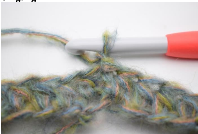
3. Lav 1 lm.