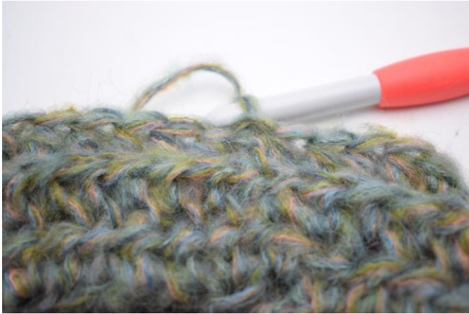
11. Hækl hstm i bml omgangen rundt. Afslut med 1 km i første hstm. (58)