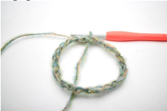
1. Slå 58 lm op. Saml din lm-række med 1 km.