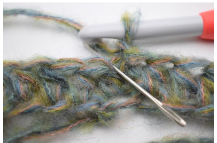
4. Hækl hstm i bml i første m. Nålen her viser den lænke din hstm skal hækles i.