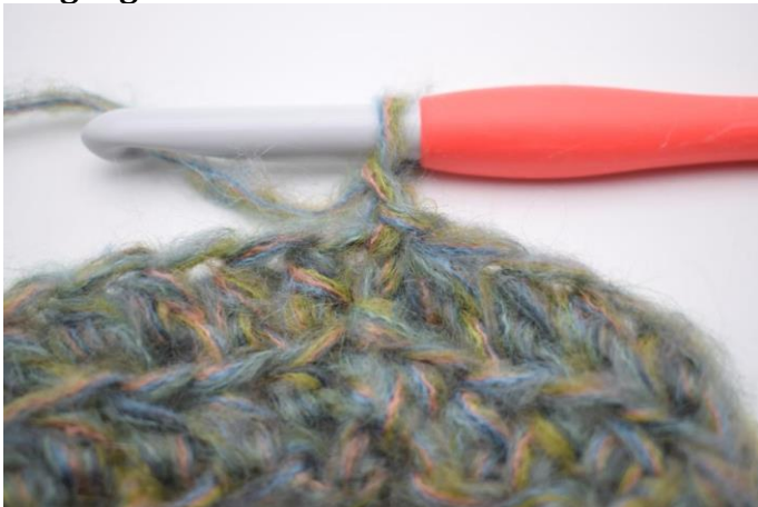
7. Lav 1 lm.