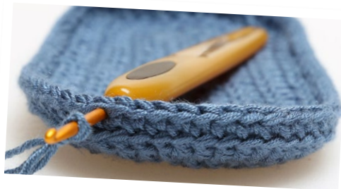
Her startes på Overstykket.