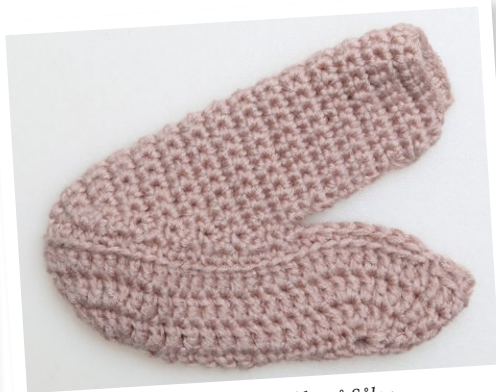
Det færdige Overstykke på Sålen.