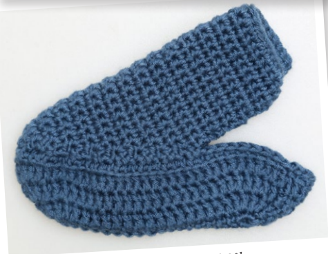
Det færdige Overstykke på Sålen.