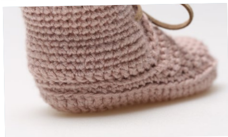
Hælkappen syet på Sålen.