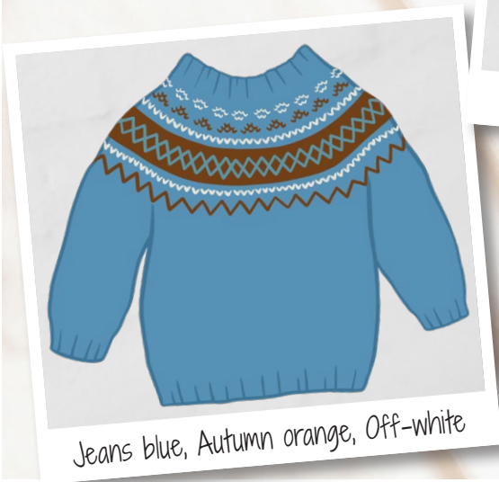
Jeans blue, Autumn orange, Off-white

Go handmade kvalitetsdesign i en unik stil