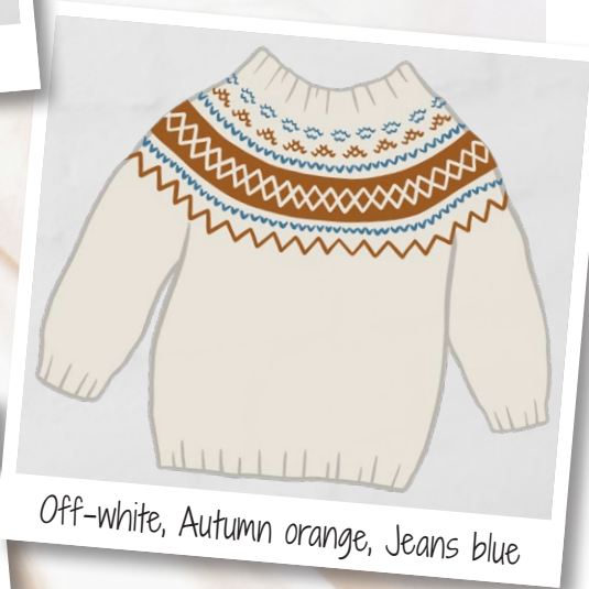
Off-white, Autumn orange, Jeans blue