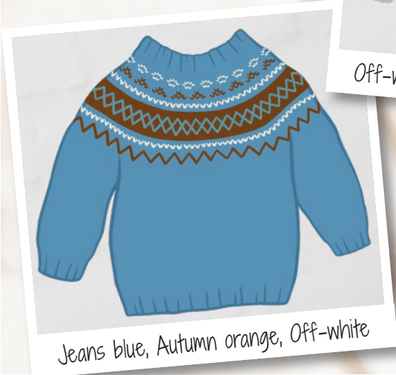
Jeans blue, Autumn orange, Off-white

Go handmade kvalitetsdesign i en unik stil