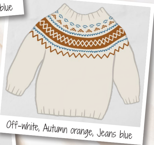
Off-white, Autumn orange, Jeans blue