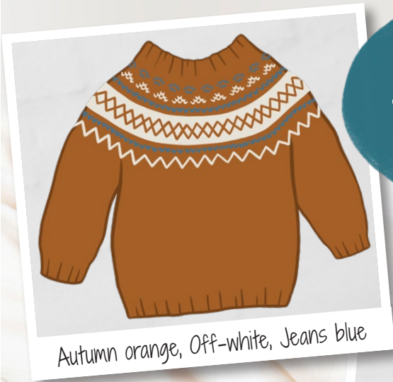
Autumn orange, Off-white, Jeans blue