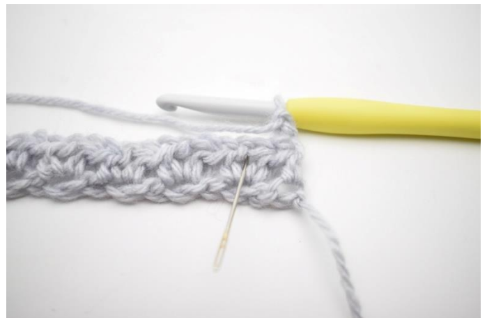
2. "Hæk 1 hstm, 1 lm og 1 hstm i lm-mellemrum fra forrige række". Nålen her viser det lm-mellemrum der skal hækles i.