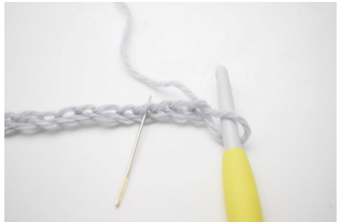
2. I 4.lm fra nålen hækles 1 hstm, 1 lm og 1 hstm. Nålen her viser den lm der skal hækles i.