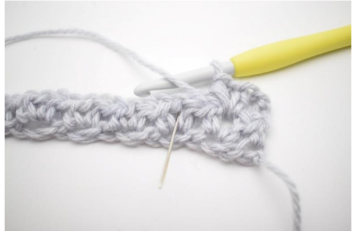
4. "Hækl 1 hstm, 1 lm og 1 hstm i næste lm-mellemrum."