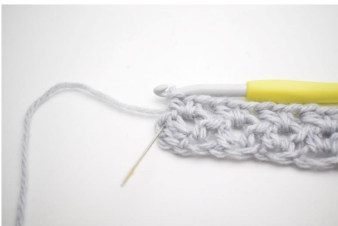
7. Hækl 1 hstm i sidste m.