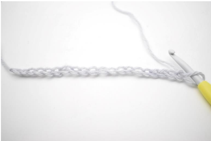
1. Slå din lm op.