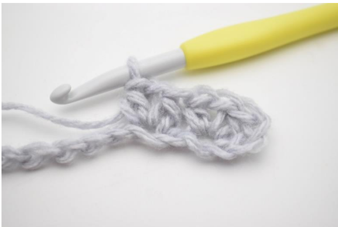
5. Hækl 1 hstm, 1 lm og 1 hstm i næste lm.