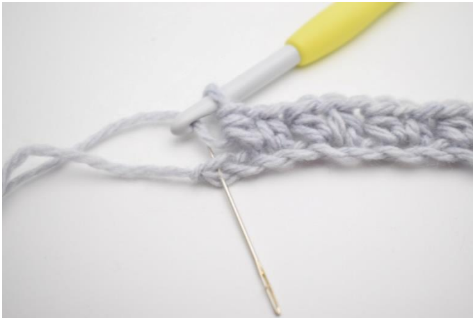
9. Spring 1 lm over og hæk 1 hstm i sidste m.