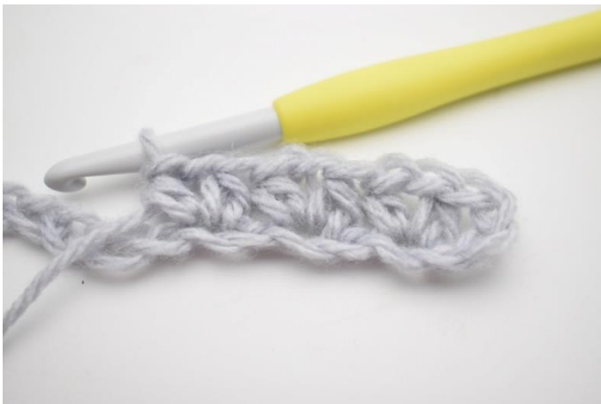
7. Hækl 1 hstm, 1 lm og 1 hstm i næste lm.