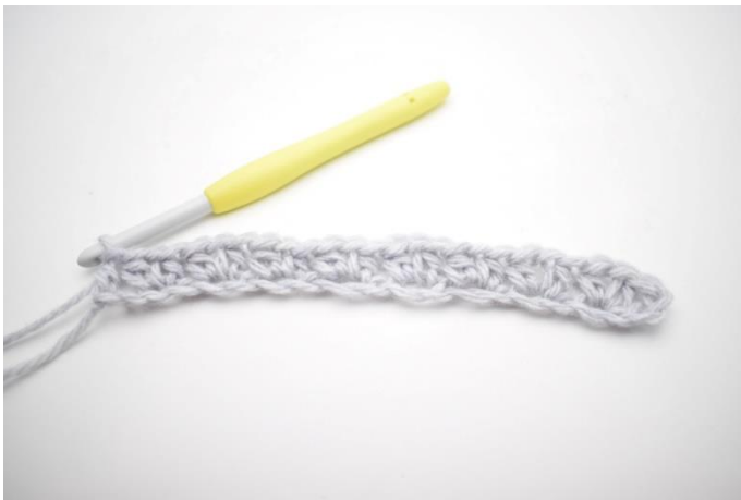
11. Det var første række.