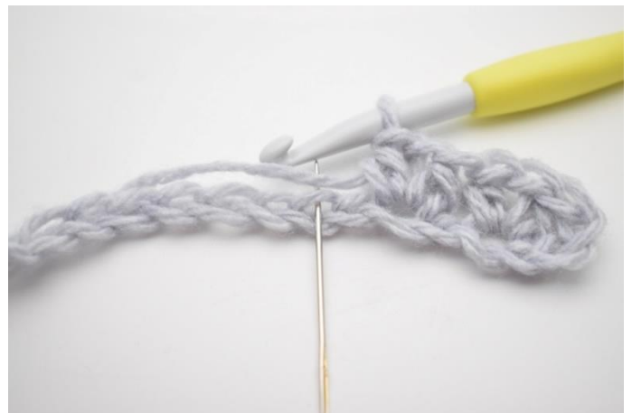
6. Spring 1 lm over.