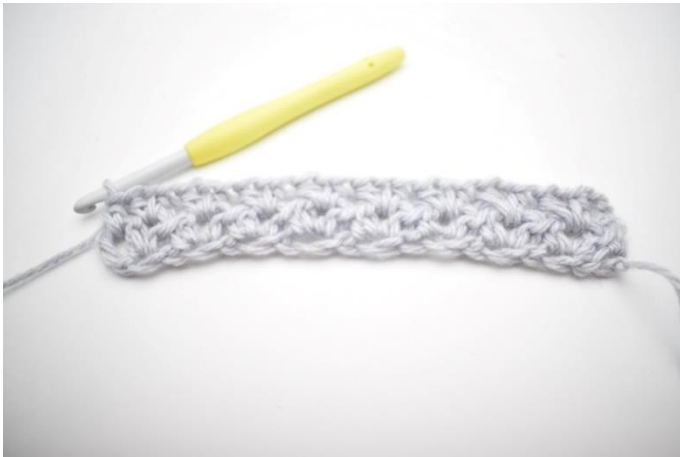
9. Det var række 2.