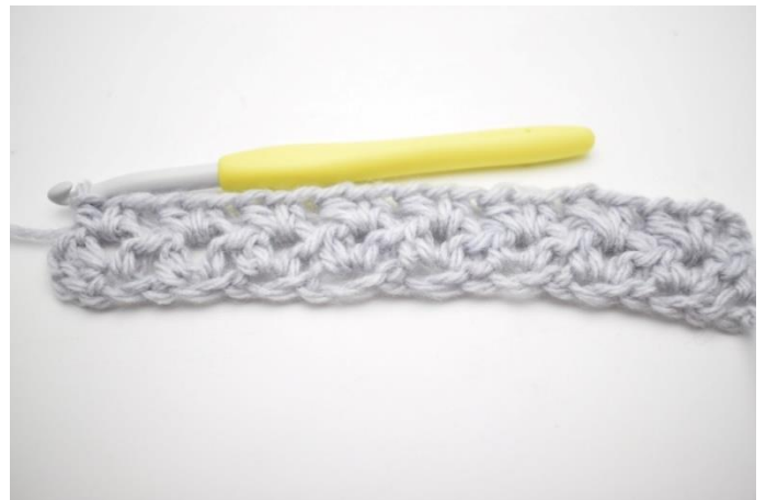
6. Gentag "til" rækken ud.