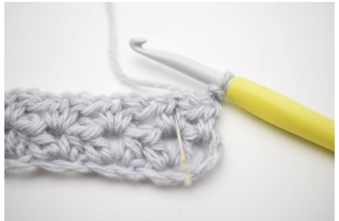
2. "Hækl 1 hstm, 1 lm og 1 hstm i første mellemrum fra forrige række". Nålen her viser hvor der skal hækles.