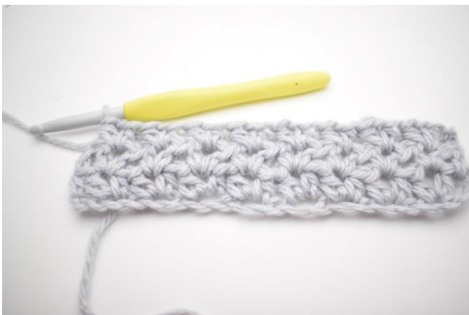
3. Gentag "til" rækken ud.