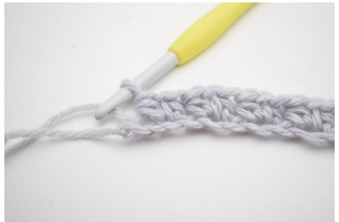
8. "Spring 1 lm over. Hækl 1 hstm, 1 lm og 1 hstm i næste lm". Gentag "til" rækken ud til du har 2 lm tilbage.