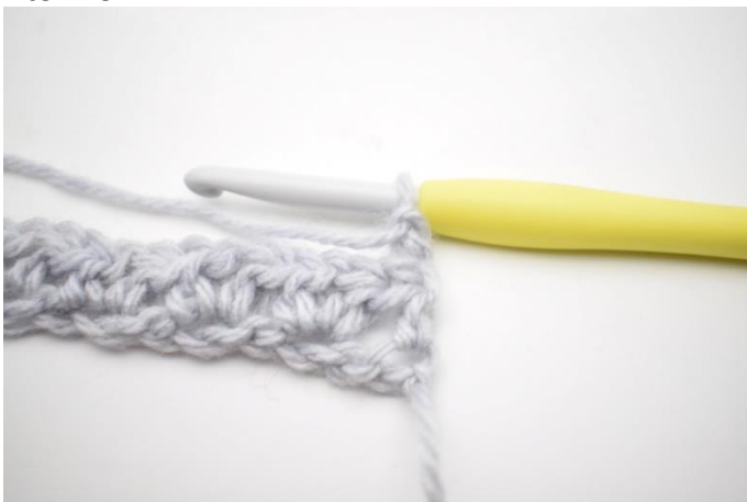
1. Vend dit arbejde med 2 lm.