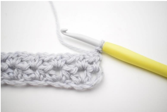
1. Række 3 hækles som række 2. Vend dit arbejde med 2 lm.