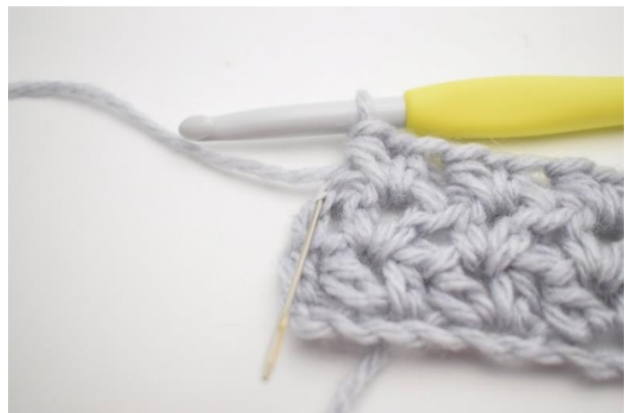
4. Hækl 1 hstm i sidste m.