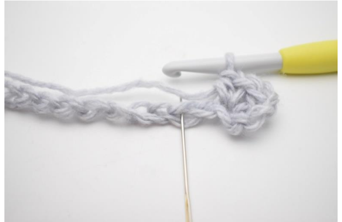
4. Spring 1 lm over.