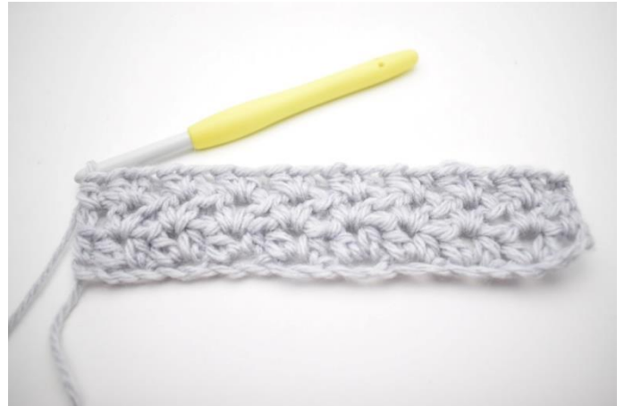
6. Det var række 3.