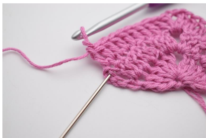
6. I sidste m hækles 2 stgm og 1 dbstgm.