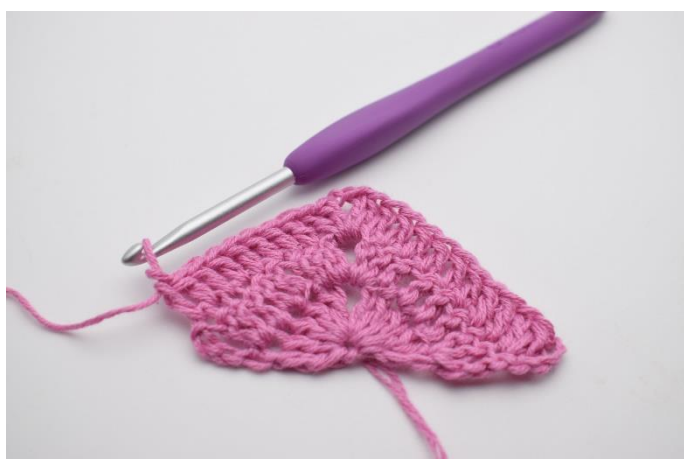
5. Hækl 1 stgm i de næste 8 m.