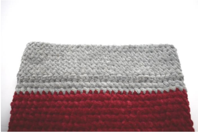
Kanten er nu hæklet færdig.