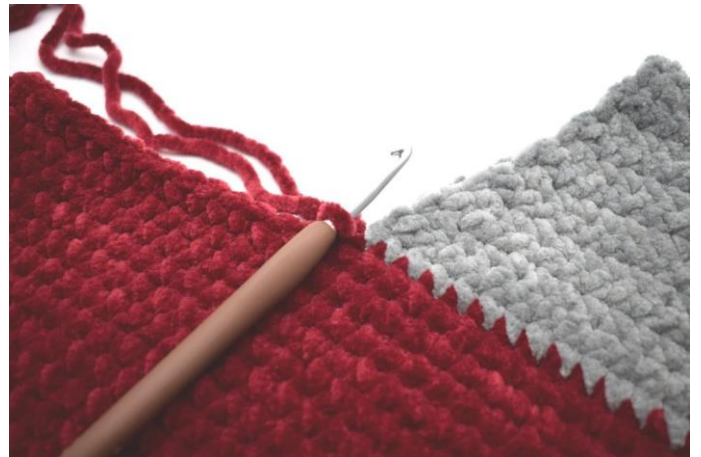
Indsæt det røde garn.