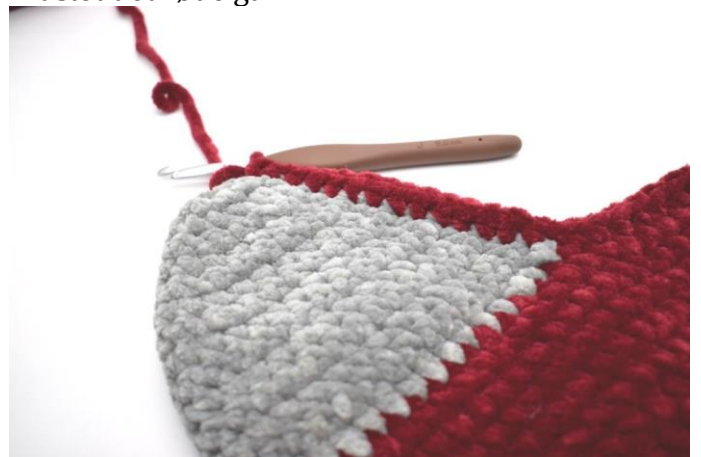
Hækl nu 14 fm langs den ene side af hælen