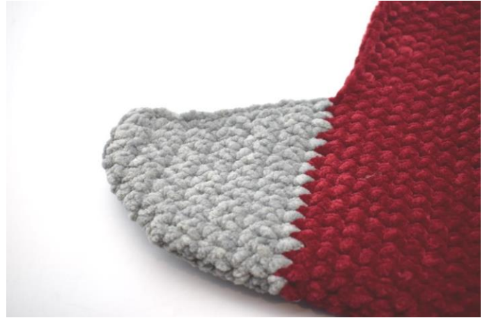
Sy enden sammen på vrangsiden. Din hæl er nu færdig.