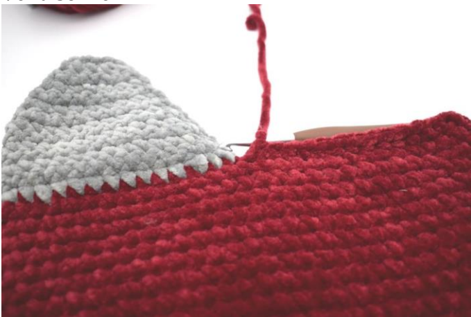
Hækl 1 fm i 32 m frem til hvor hælen starter.