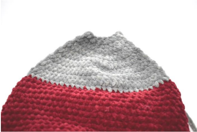
Sådan ser hælen ud nu.