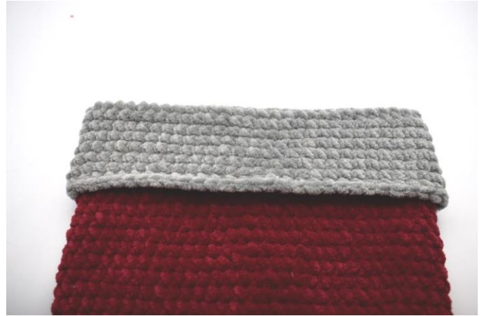
Fold kanten ned over sokken.