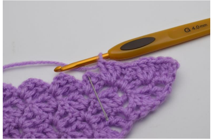
8. Spring 2 stgm over og hæk 1 fm i lm-buen.