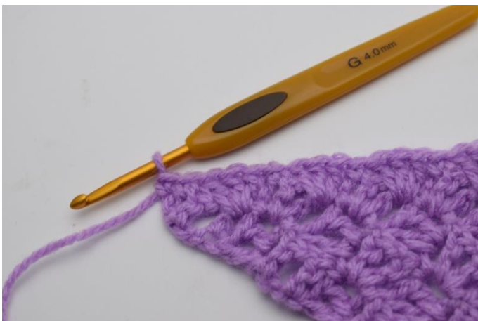
11. Afslut med fm i de sidste stgm. Klip og hæft enden.