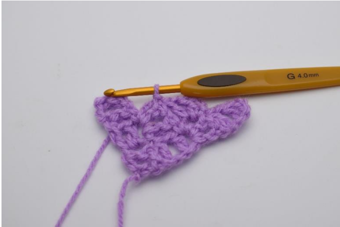
5. Lav 1 km i firkanten under.