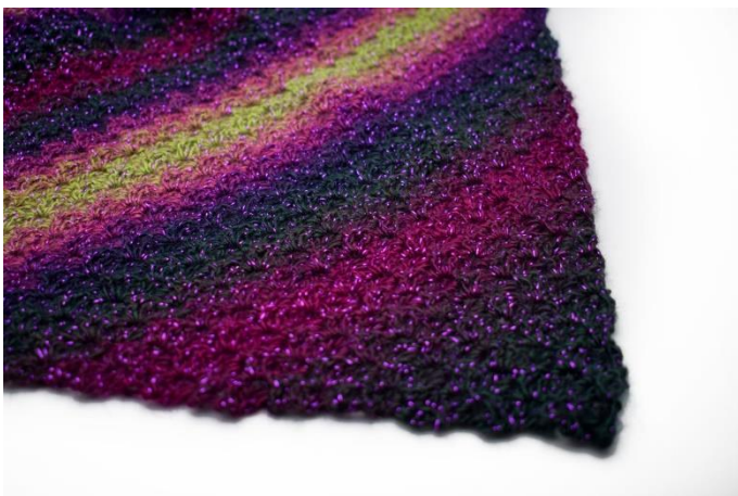
Gentag rækkerne til du i alt har 89 rækker, eller den ønskede størrelse.