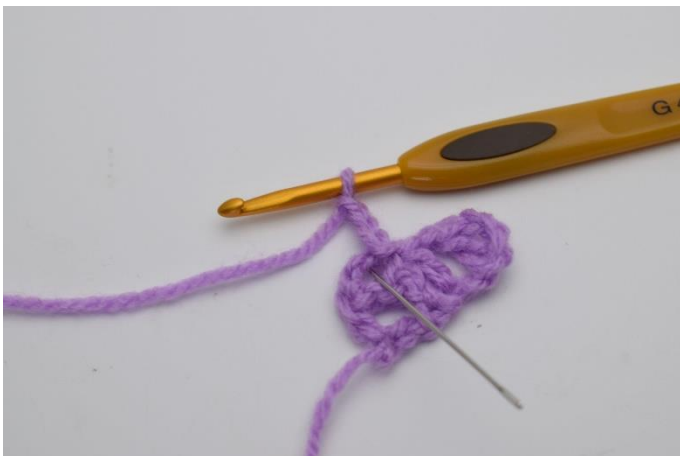
7. Hækl "1 stgm, 1 lm og 1 stgm" ned i den lmbue du netop har lavet 1 km i.