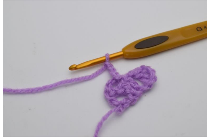
6. Lav 3 lm.