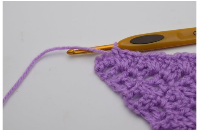
10. Gentag rækken ud.