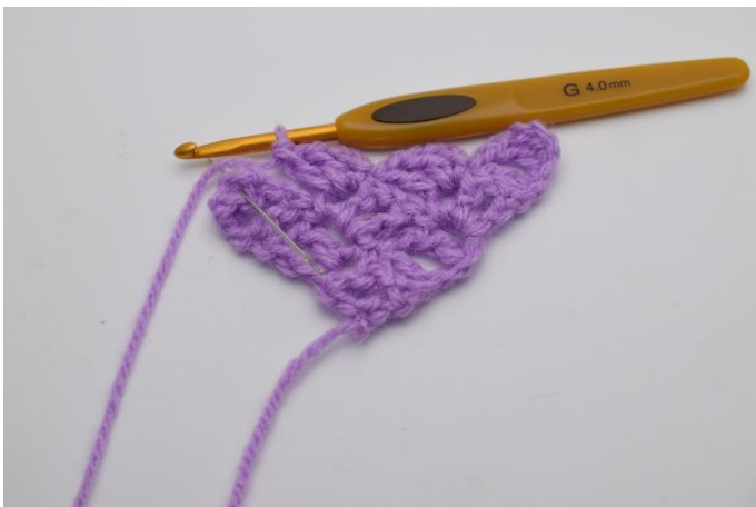
7. Lav 1 km i firkanten under.