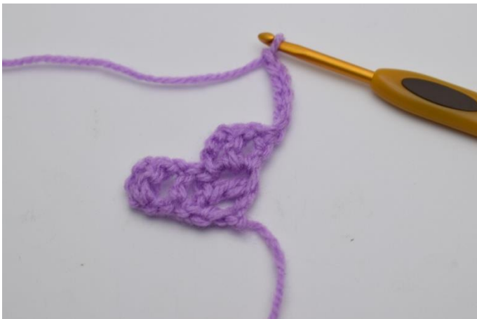
1. Vend arbejdet og lav 6 lm.