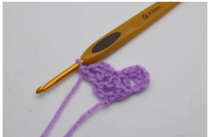
8. Der er nu dannet endnu en "firkant". Og række 2 har nu 2 "firkanter".