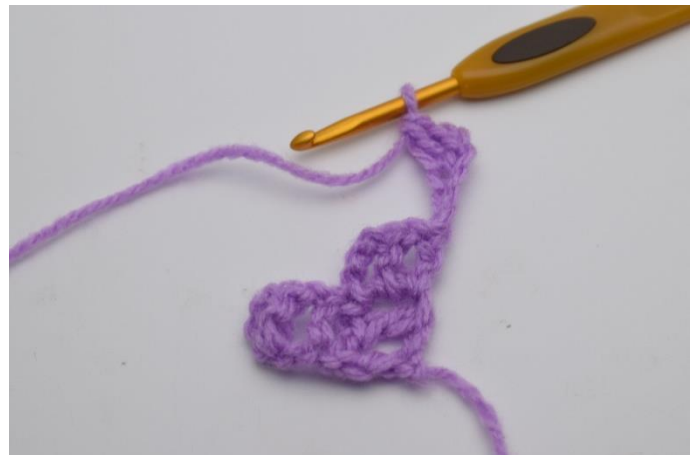
2. Hækl 1 stgm i 4. lm fra nålen.