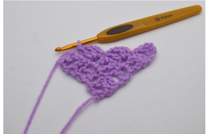
6. Lav 3 lm og hækl 1 stgm, 1 lm og 1 stgm ned i den lm-bue du netop har lavet 1 km i.