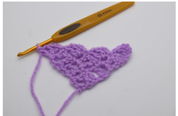
8. Lav 3 lm, og hækl 1 stgm, 1 lm og 1 stgm ned i den lm-bue du netop har lavet 1 km i.