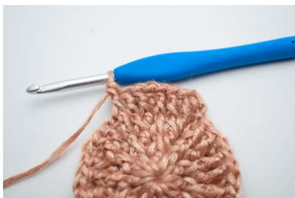
25. "Hækl 1 stgm i næste m, hækl 1 frstgm omkring stolpen på første m og de efterfølgende 2 m".