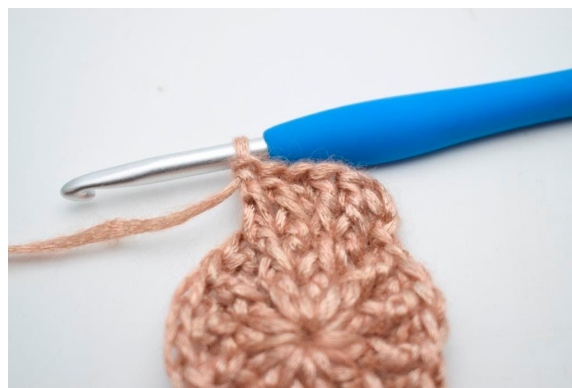
18. Hækl 1 frstgm omkring den efterfølgende m”.