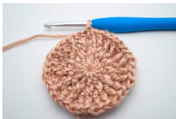
20. Gentag “til” omgangen rundt. Afslut med 1 km. (36)