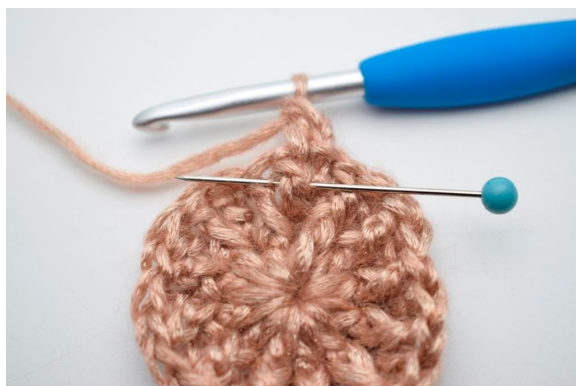
11. Hækl 1 frstgm omkring stolpen på samme m.