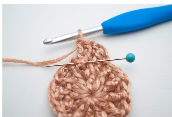
16. Hækl 1 frstgm omkring stolpen på samme m.