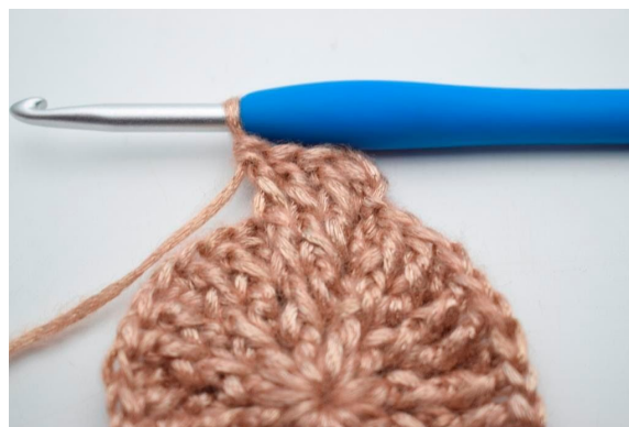
24. Hækl 1 frstgm omkring de efterfølgende 2 m".