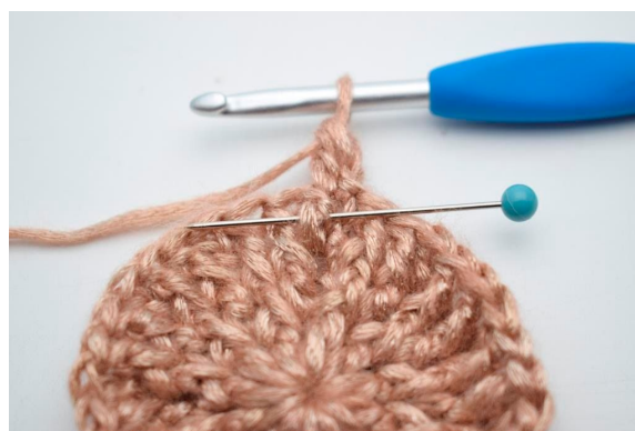
22. Hækl 1 frstgm omkring stolpen på første m.