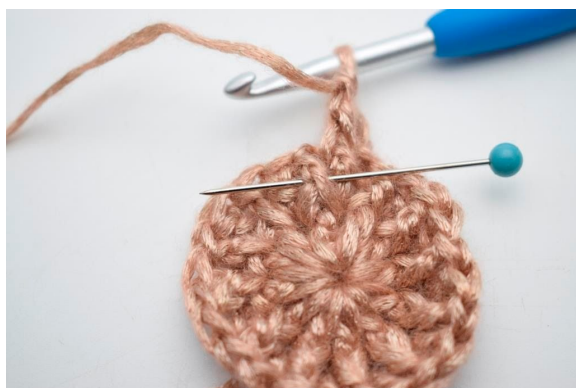
13. Hækl 1 frstgm omkring den efterfølgende m”.