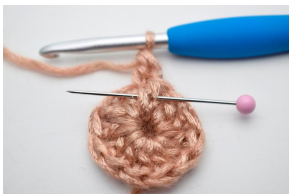
3. Hækl 1 frstgm omkring stolpen på samme m". En frstgm er en forfra relief-stangmaske som hækles forfra omkring stgm stolpen fra forrige omgang. Nålen her viser hvordan din stgm skal hækles forfra omkring stolpen.