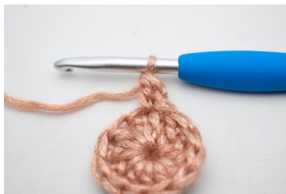
2. Lav 1 lm. "Hækl 1 stgm i første m.