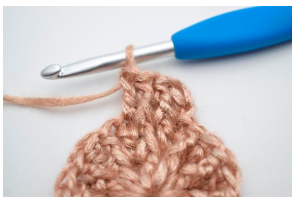
15. “Hækl 1 stgm i næste m..