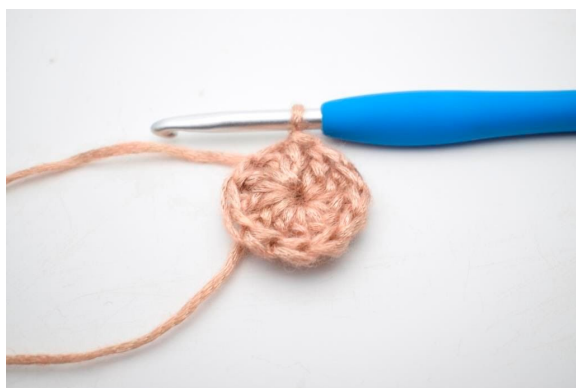
1. Lav en mr. Lav 1 lm og hækl 12 stgm i ringen. Afslut med 1 km. (12)