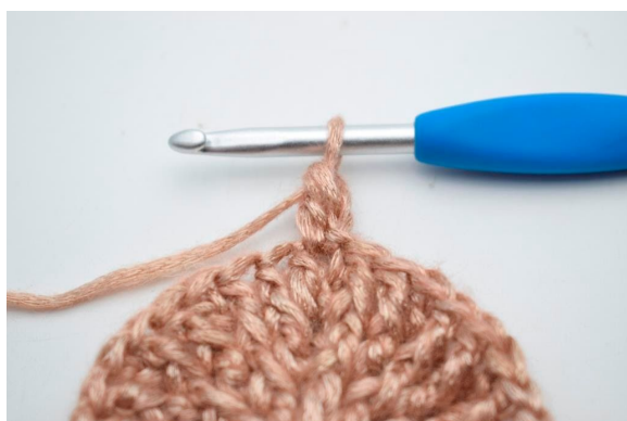
21. Lav 1 lm. “Hækl 1 stgm i første m.