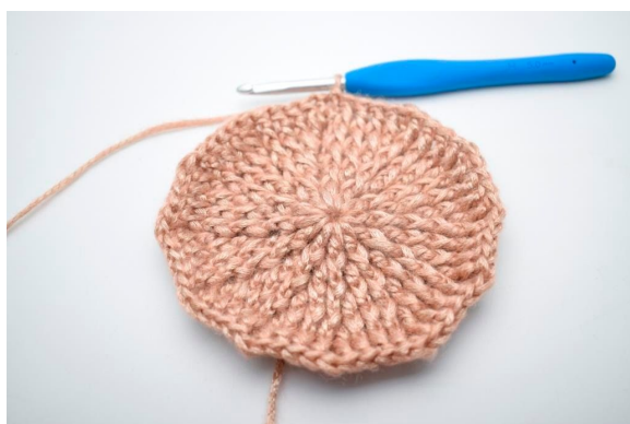
27. Gentag med udtagninger som beskrevet i opskriften.