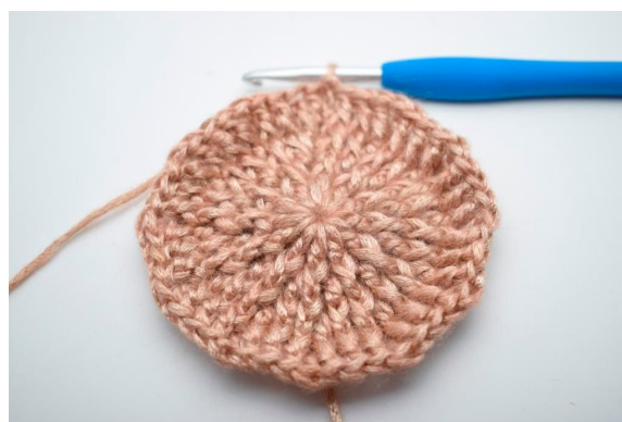
26. Gentag "til" omgangen rundt. Afslut med 1 km. (48)