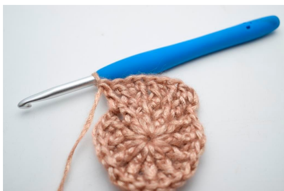
19. “Hækl 1 stgm i næste m og hækl 1 frstgm omkring stolpen på samme m og den efterfølgende m”.