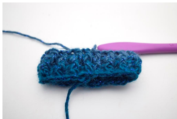
18. Gentag "til" omgangen rundt. Afslut med 1 km. = 32 (34)