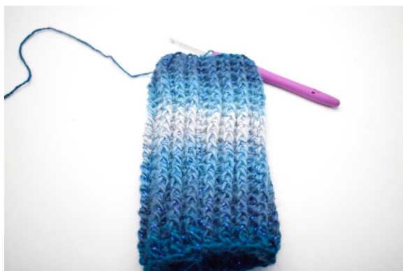
19. Lav 1 lm. "Hækl 1 frstgm omkring første m, hækl 1 brstgm omkring næste m". Gentag "til" omgangen rundt. Afslut med 1 km. = 32 (34)