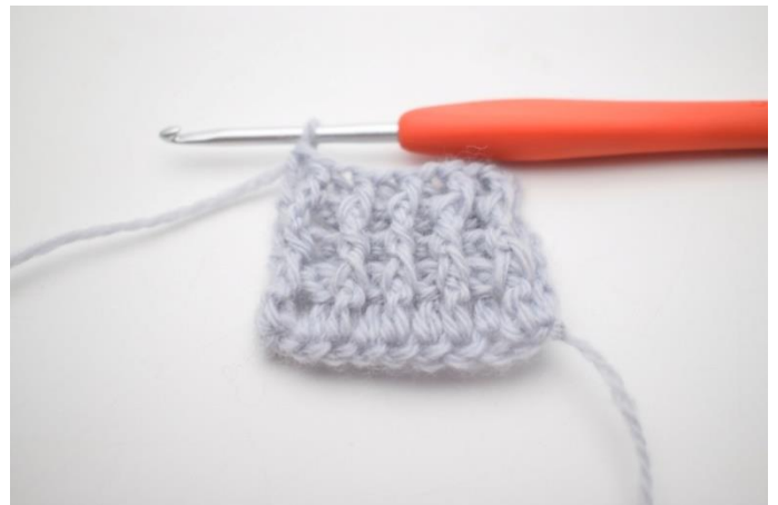
4. Hækl 1 frstgm omkring næste m. Hækl 1 alm stgm i sidste m.