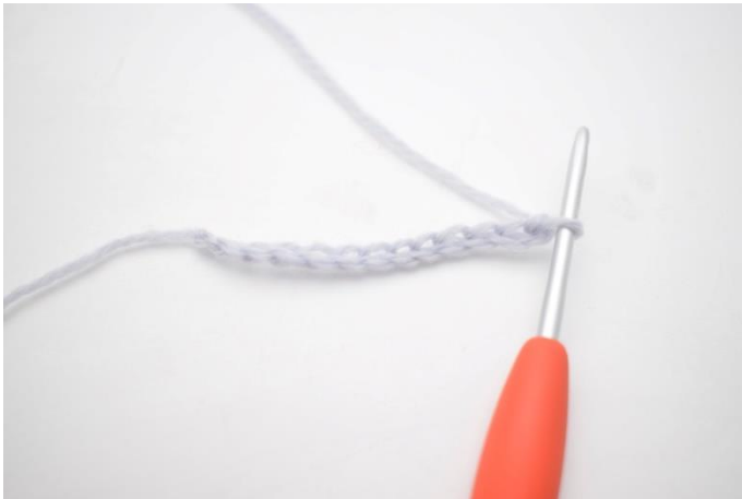
1. Slå 25 lm op.