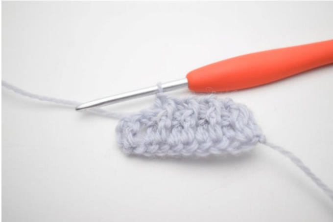
7. Gentag "til" til du har 2 m tilbage.