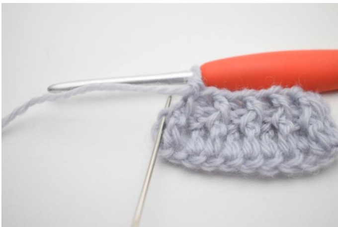
9. Hækl 1 alm stgm i sidste m.