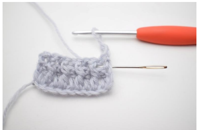
2. Hækl 1 brstgm omkring første m. Nålen her markerer hvordan din brstgm skal hækles bagfra omkring stgm stolpen på forrige række.