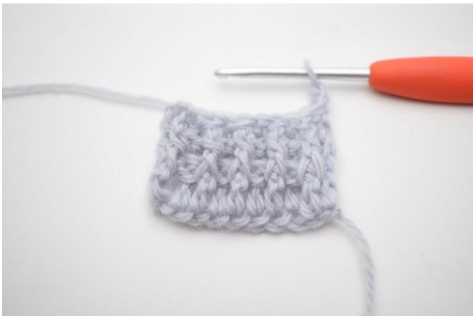
1. Denne række hækles som række 2. Vend med 3 lm.