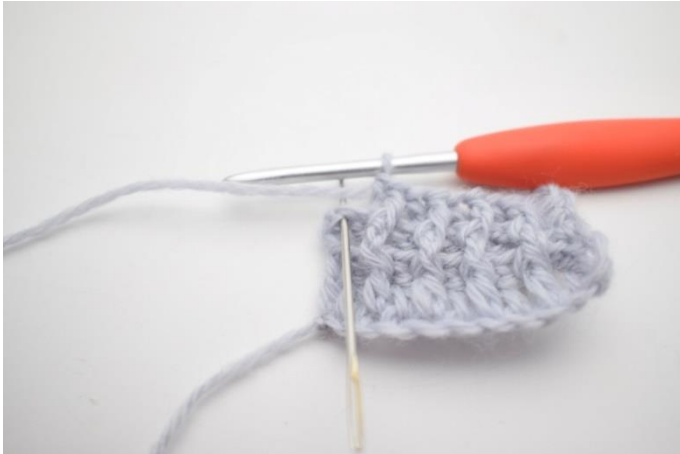
9. Hækl 1 alm stgm i sidste m.