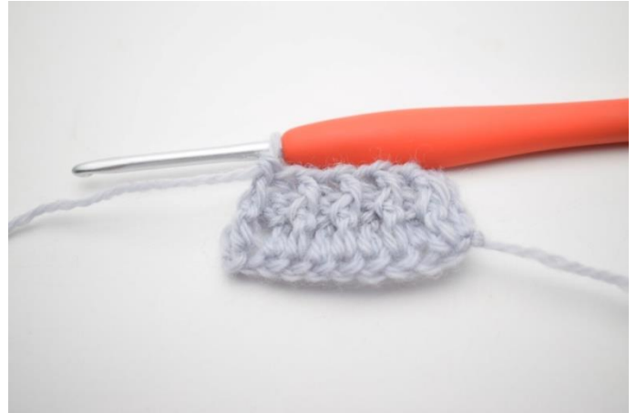
8. Hækl 1 frstgm omkring næste m.