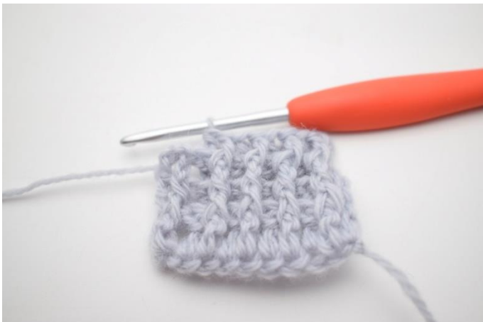
3. Gentag "til" til du har 2 m tilbage.