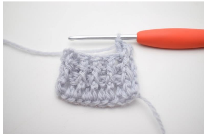
2. "Hækl 1 frstgm omkring første m, hækl 1 brstgm omkring næste m".