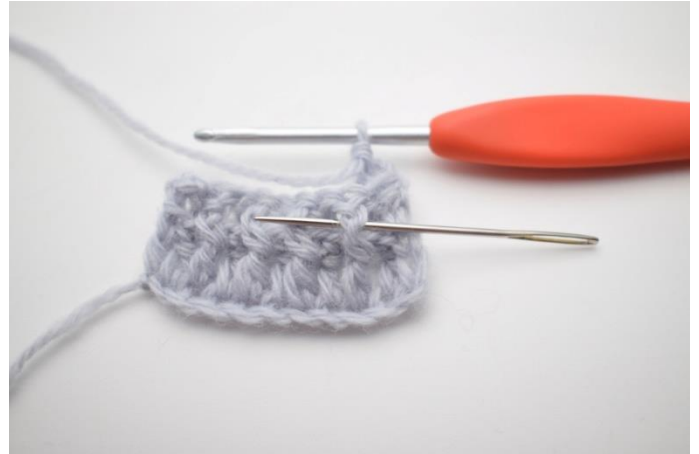
4. Hækl 1 frstgm omkring næste m. Nålen her markerer hvordan din frstgm skal hækles forfra omkring stgm stolpen på forrige række.