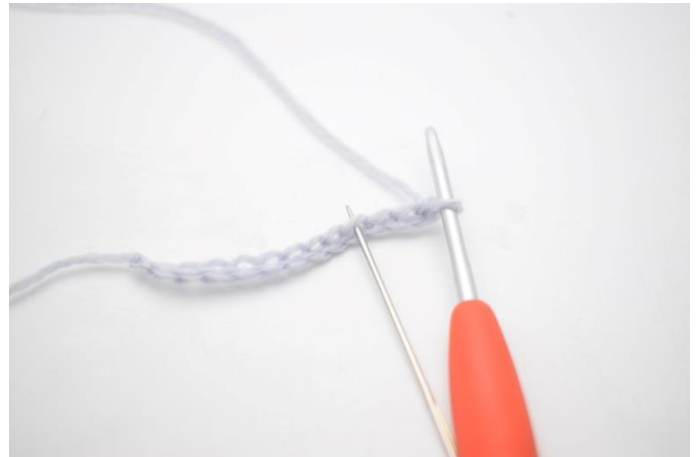
2. Hækl 1 stgm i 4. lm fra nålen.