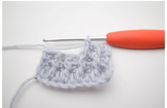
6. "Hækl 1 brstgm omkring første m, hækl 1 frstgm omkring næste m".