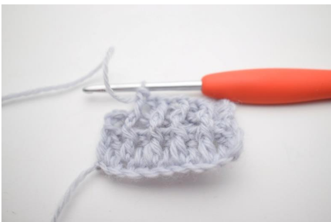
7. Gentag "til" til du har 2 m tilbage.