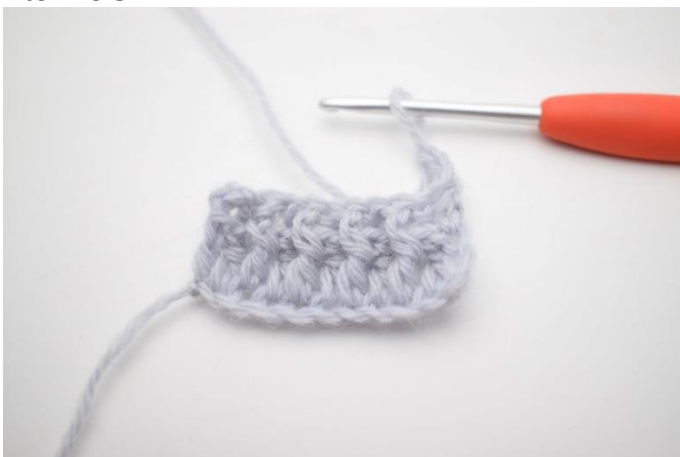
1. Vend med 3 lm.