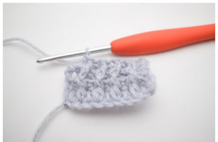
8. Hækl 1 brstgm omkring næste m.