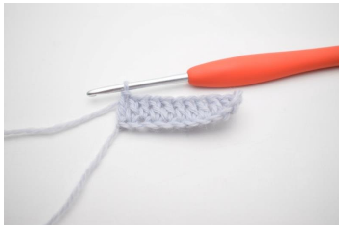
4. Hækl stgm rækken ud. (23)