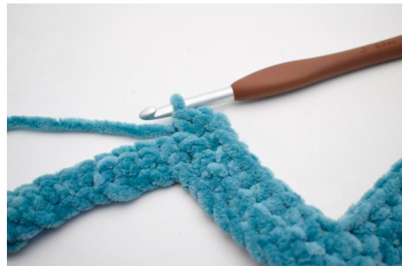
21. Hækl 3 fm i den efterfølgende m".