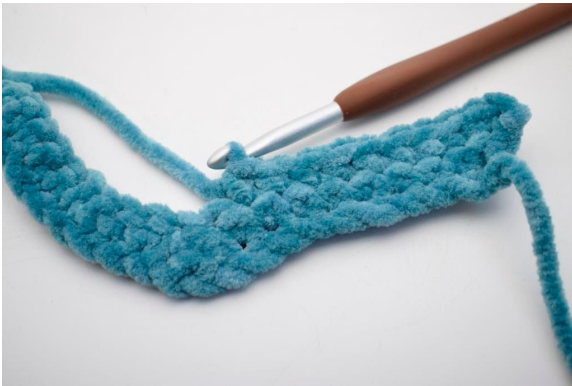
18. "Hækl 1 fm i de næste 8 m.