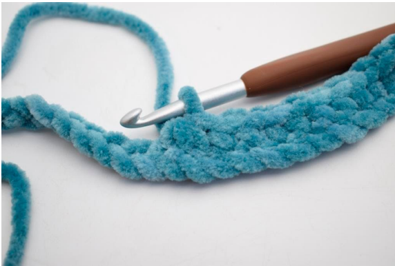
13. Hækl 3 fm sm.