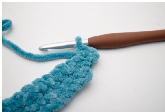
28. Hækl 2 fm i første m.