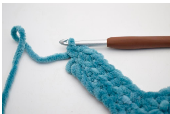
26. Hækl 2 fm i sidste m.