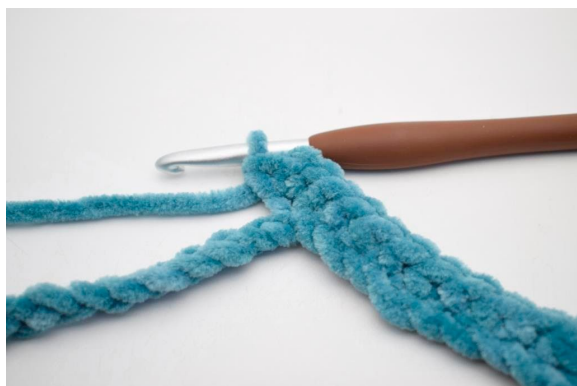
7. Hækl 3 fm i den efterfølgende lm”.