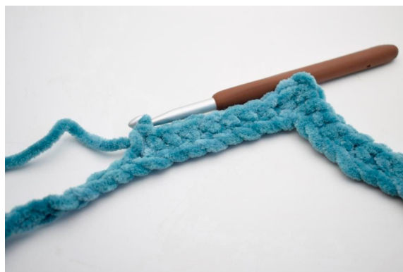
8. “Hækl 1 fm i de næste 8 lm.