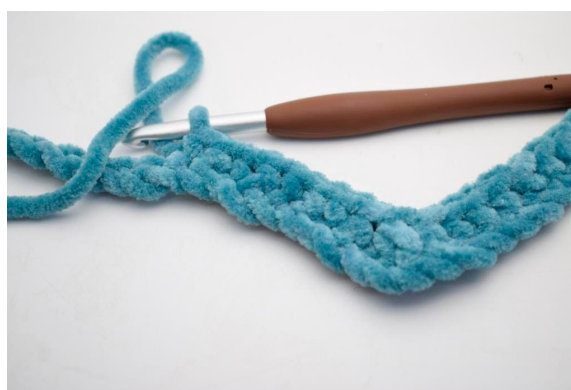
10. Hækl 1 fm i de næste 8 lm.