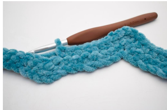
23. Hækl 1 fm i de næste 8 m.