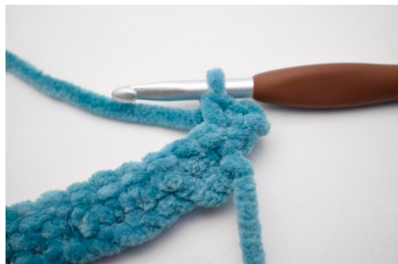
17. Hækl 2 fm i første m.