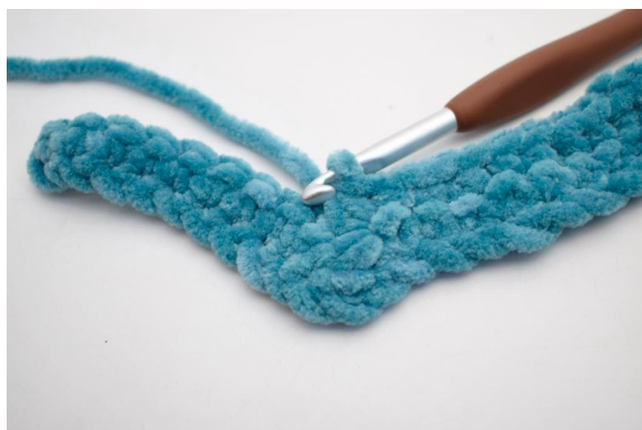
24. Hækl 3 fm sm.