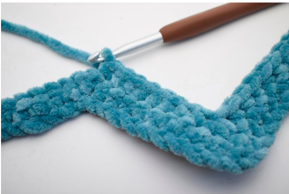
20. Hækl 1 fm i de næste 8 m.