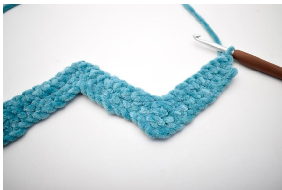
27. Denne række hækles som række 2. Vend med 1 lm.