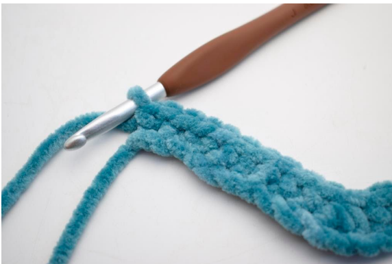
15. Hækl 2 fm i sidste lm.