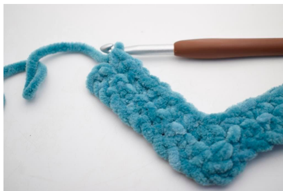
25. Hækl 1 fm i de næste 8 m.