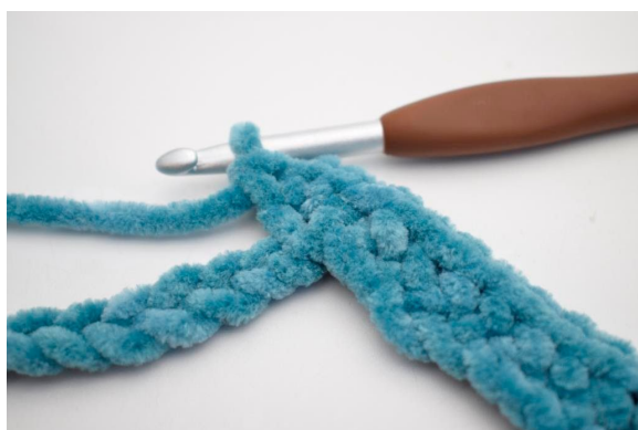
11. Hækl 3 fm i den efterfølgende lm”.