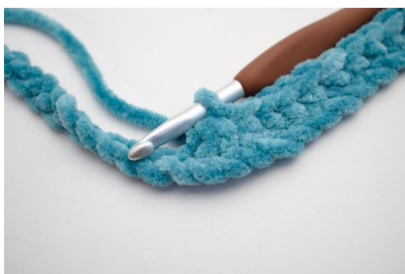
9. Hækl 3 fm sm.