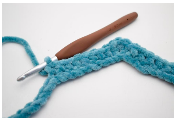
12. Hækl 1 fm i de næste 8 lm.