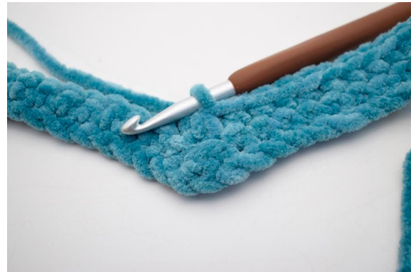
19. Hækl 3 fm sm.