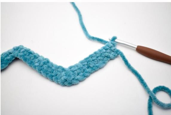
16. Vend med 1 lm.