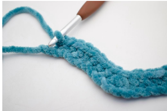
14. Hækl 1 fm i de næste 8 lm.