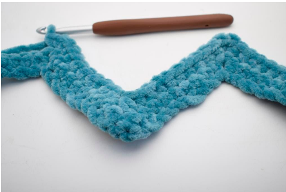
22. "Hækl 1 fm i de næste 8 m, hækl 3 fm sm. Hækl 1 fm i de næste 8 m, 3 fm i den efterfølgende m".