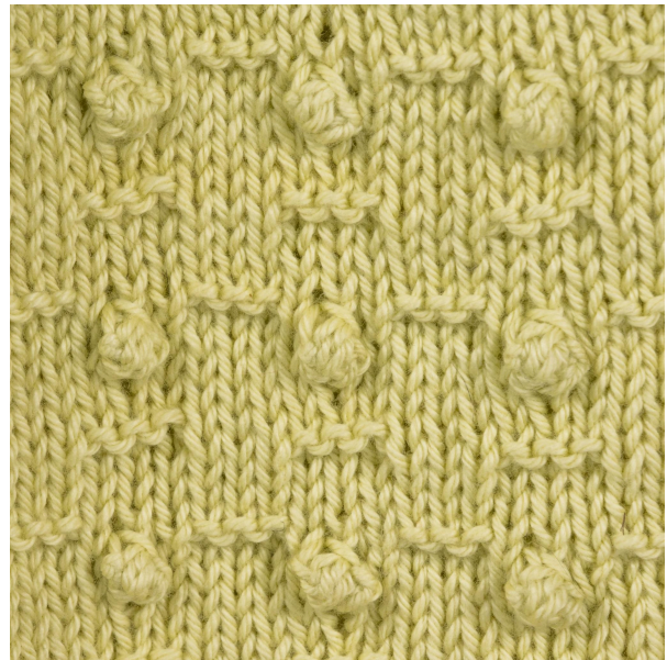
Rigtig god fornøjelse! Sanna Mård Castman - Solorado