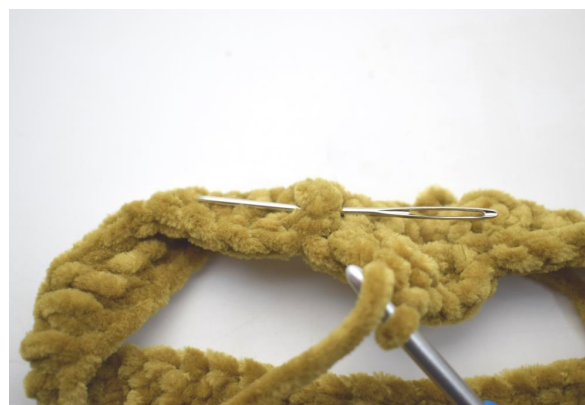
12. Hækl 1 brstgm omkring næste m.