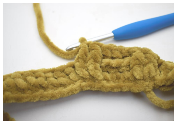
14. "Hækl 1 frstgm omkring de første 2 m.