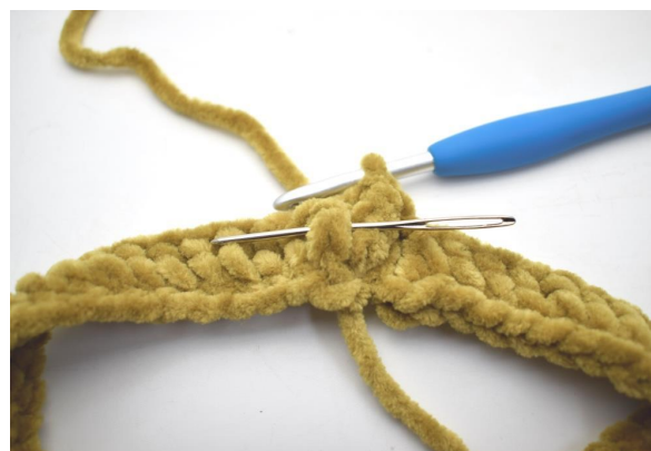
6. Hækl 1 frstgm omkring næste m.