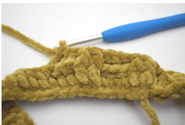
15. Hækl 1 brstgm omkring de efterfølgende 3 m".