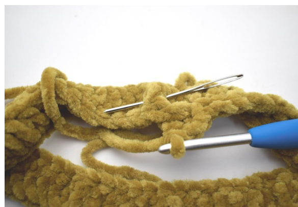
8. Hækl 1 brstgm omkring næste m. Nålen her viser hvordan din brstgm skal hækles bagfra omkring stgm stolpen på forrige række.