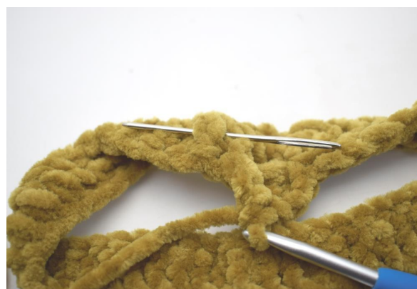
10. Hækl 1 brstgm omkring næste m.