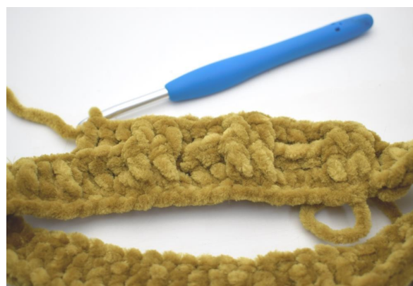
16. "Hækl 1 frstgm omkring de første 2 m, 1 brstgm omkring de efterfølgende 3 m".