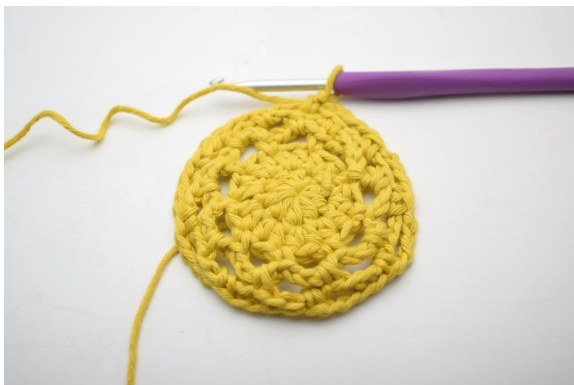
24. Gentag "til" omgangen rundt. (9 lm-buer)