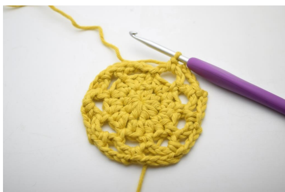
19. Gentag "til" omgangen rundt.