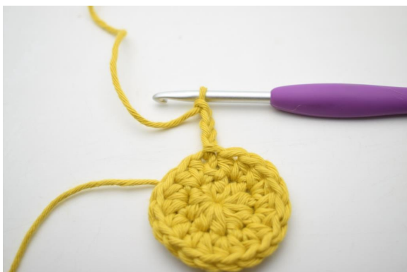
4. "Lav 4 lm.