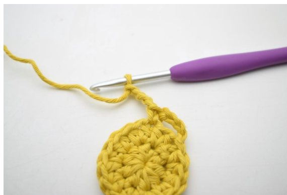
7. "Lav 4 lm.