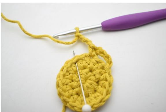
8. Spring 1 m over og hæk 1 fm i næste m".