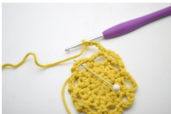
17. "Lav 4 lm, hækl 1 fm i næste lm-bue".