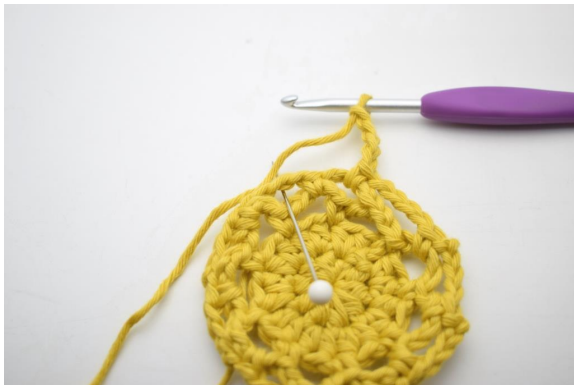
22. "Lav 4 lm, hækl 1 fm i næste lm-bue".