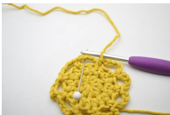
13. Lav 2 km op langs den første lm-bue, så du starter i midten af den.