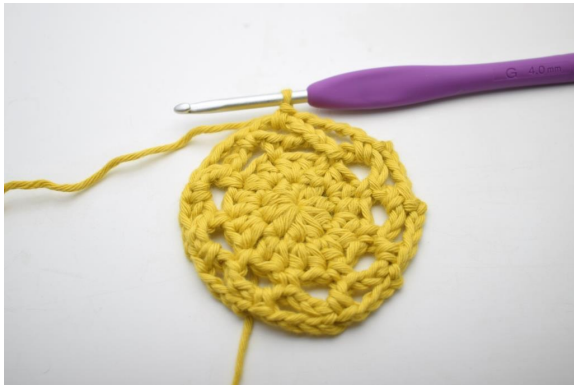
21. Sådan. (9 lm-buer)