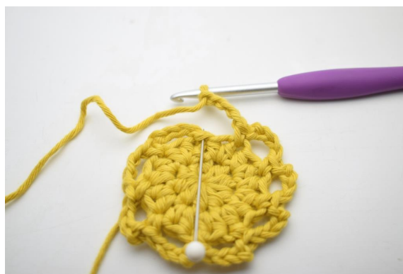
11. Afslut med 1 km.