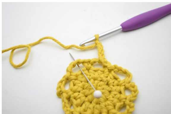
15. "Lav 4 lm, hækl 1 fm i næste lm-bue".