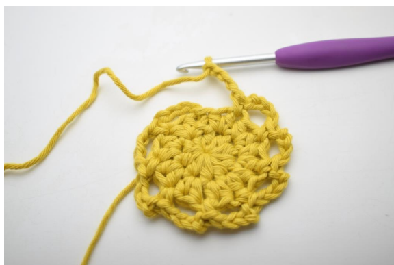
10. Gentag "til" omgangen rundt.