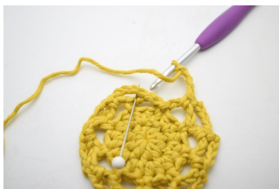
20. Omgangen afsluttes med 1 fm i den første af de lm-bue som blev dannet på denne omgang.