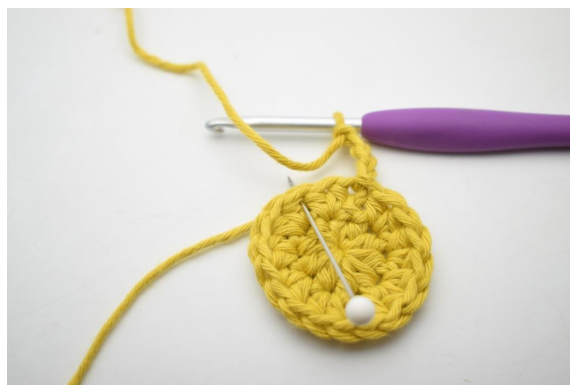
5. Spring 1 m over og hæk 1 fm i næste m".