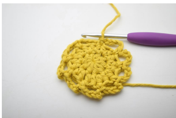
12. Sådan. (9 lm-buer)