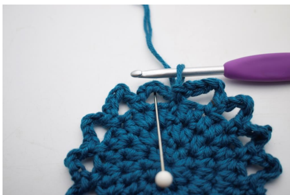
14. Lav 3 km op langs den første lm-bue, så du starter i midten af den.