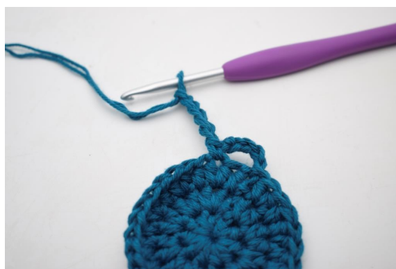
8. "Lav 5 lm.