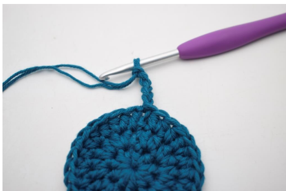
5. "Lav 5 lm.