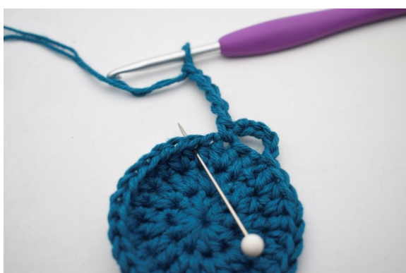
9. Spring 1 m over og hækl 1 fm i næste m".