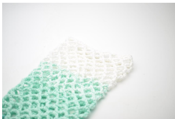
32. Klip garnet og hæft ender.