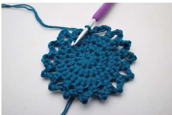
13. Sådan. (15 lm-buer)