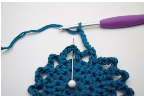
16. "Lav 5 lm, hækl 1 fm i næste lm-bue".