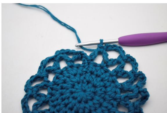
20. Gentag "til" omgangen rundt.