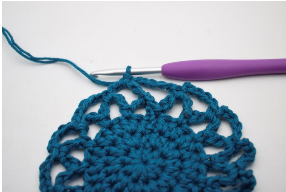
21. Sådan. (15 lm-buer)