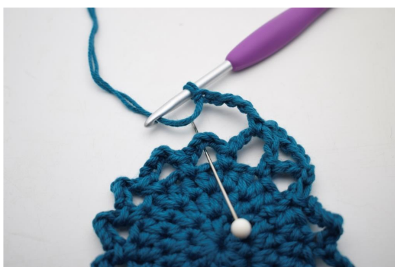
18. "Lav 5 lm, hækl 1 fm i næste lm-bue".