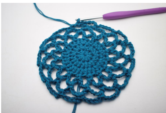
24. Gentag "til" omgangen rundt. (15 lm-buer)