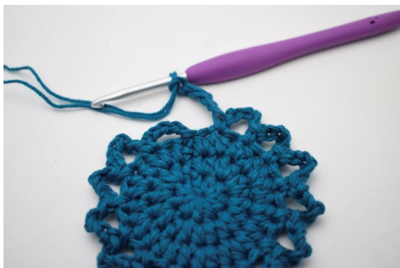
11. "Lav 5 lm, spring 1 m over og hæk 1 fm i næste m". Gentag "til" omgangen rundt.