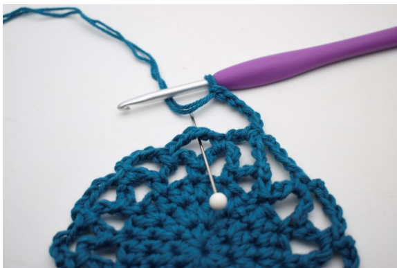
22. "Lav 5 lm, hækl 1 fm i næste lm-bue".