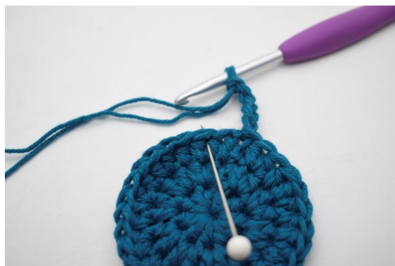
6. Spring 1 m over og hækl 1 fm i næste m".