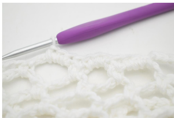
30. “Hækl 1 fm i næste m, hækl 3 fm i den efterfølgende lm-bue”.