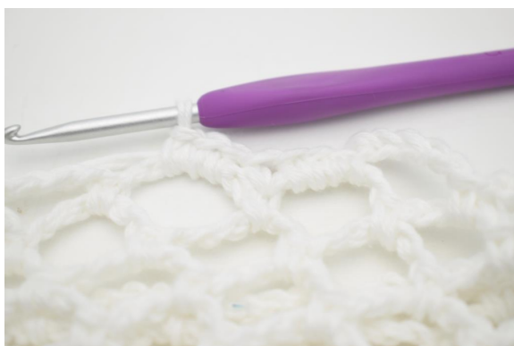
29. Hækl 3 fm i den efterfølgende lm-bue”.