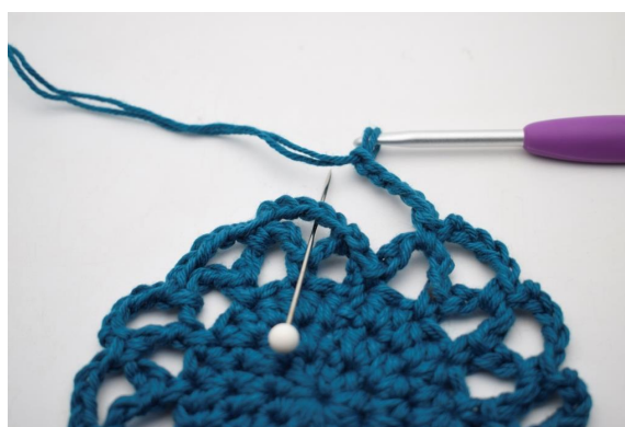
20. Omgangen afsluttes med 1 fm i den første af de lm-bue som blev dannet på denne omgang.