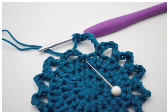
12. Afslut med 1 km.