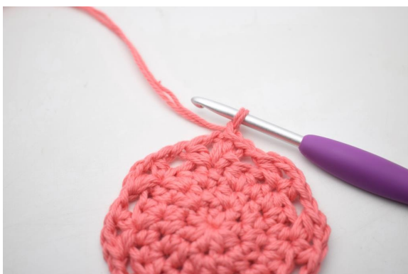
16. Lav 1 lm.