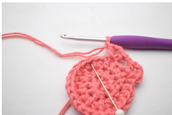
11. “Spring 2 m over og hæk 1 hstm, 2 lm og 1 hstm i næste m. Lav 1 lm”.