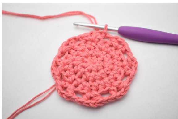
13. Gentag “til” omgangen rundt. Afslut med 1 km.