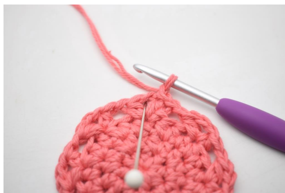
17. "Hækl 4 hstm, 1 lm og 4 hstm i lm-buen".