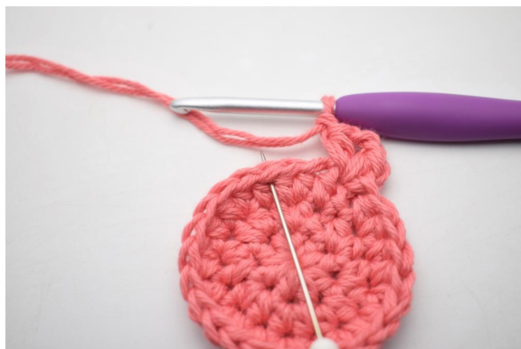
9. “Spring 2 m over og hæk 1 hstm, 2 lm og 1 hstm i næste m. Lav 1 lm”.