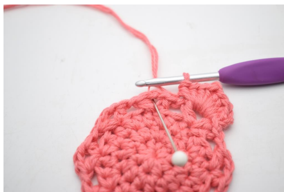
19. "Hækl 4 hstm, 1 lm og 4 hstm i lm-buen".