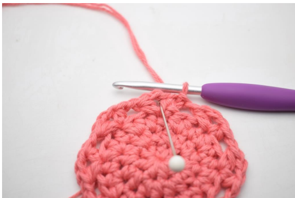
14. Lav km hen til den første lm-bue.