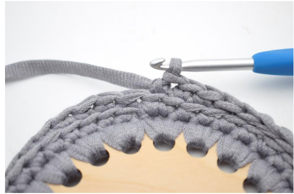
6. Hækl fm i bml omgangen rundt.