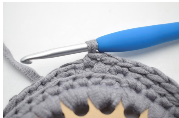
4. "Hækl 1 fm i næste m.