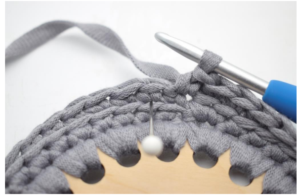
2. Hækl 1 dfm i næste m". En dfm er en alm fastmaske, men som hækles i masken under så den bliver dyb. Nålen her viser hvor din dfm skal hækles.