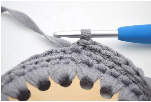
1. "Hækl 1 fm i første m.