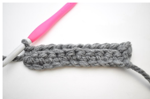
12. Hækl 1 fm i bml rækken ud. (26)