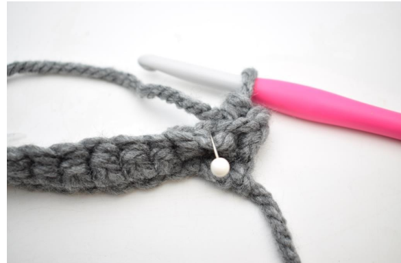
10. Hækl 1 fm i næste m i bml.