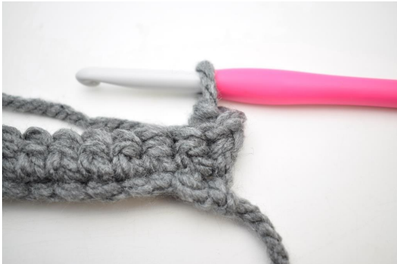
9. Sådan. Der er nu hæklet 1 fm i bml.