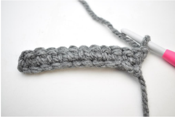
7. Vend med 1 lm.