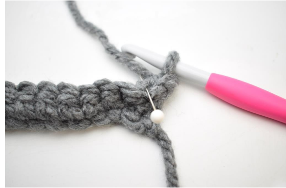
8. Hækl 1 fm i bml rækken ud. Den bagerste lænke er den lænke nålen her viser.