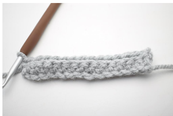
12. Hækl 1 fm i bml rækken ud. (43)