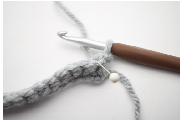
8. Hækl 1 fm i bml rækken ud. Den bagerste lænke er den lænke nålen her viser.