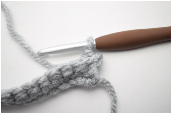
9. Sådan. Der er nu hæklet 1 fm i bml.