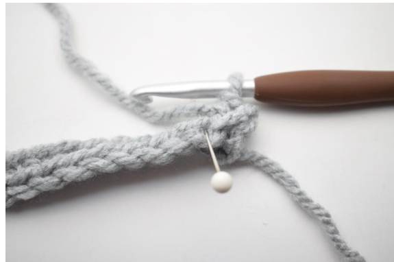
10. Hækl 1 fm i næste m i bml.