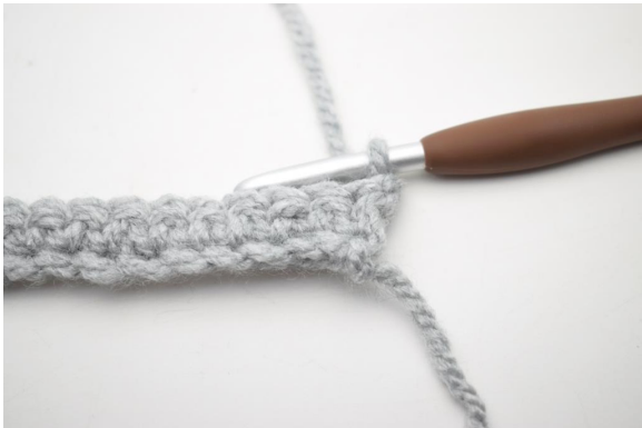
7. Vend med 1 lm.