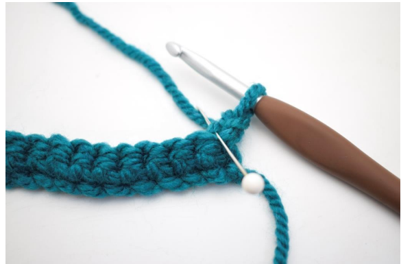
8. Hækl 1 fm i bml rækken ud. Den bagerste lænke er den lænke nålen her viser.