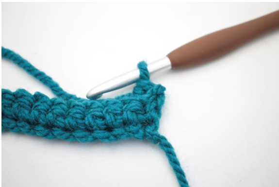
9. Sådan. Der er nu hæklet 1 fm i bml.