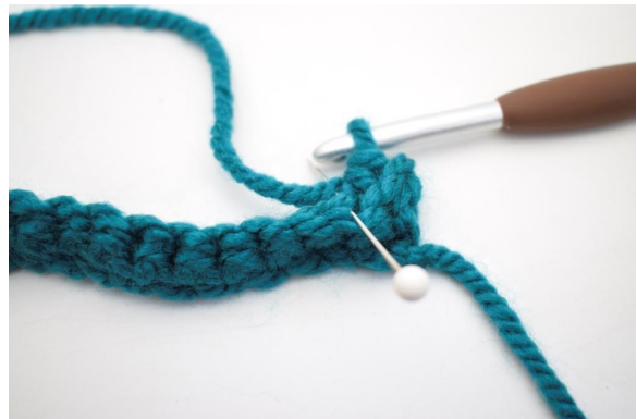
10. Hækl 1 fm i næste m i bml.