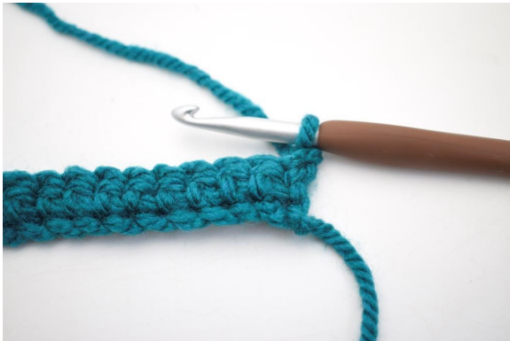
7. Vend med 1 lm.