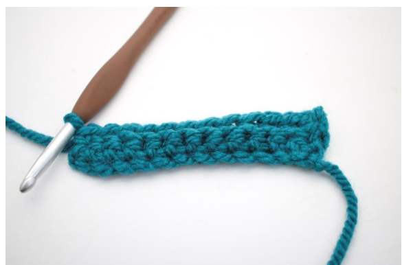
12. Hækl 1 fm i bml rækken ud. (33)