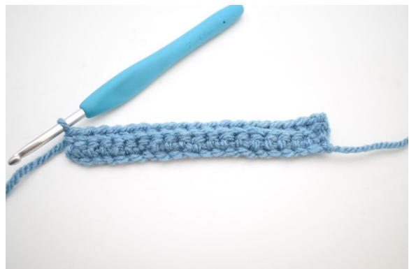
12. Hækl 1 fm i bml rækken ud. (58)