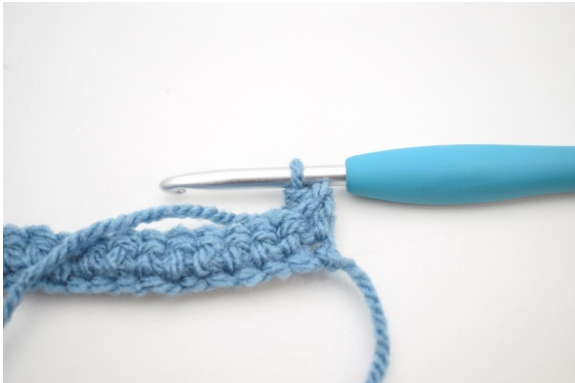
9. Sådan. Der er nu hæklet 1 fm i bml.