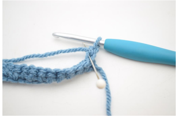
8. Hækl 1 fm i bml rækken ud. Den bagerste lænke er den lænke nålen her viser.