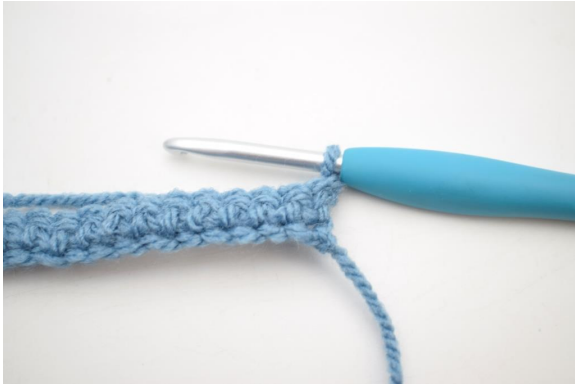
7. Vend med 1 lm.