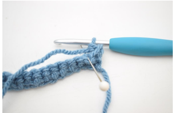
10. Hækl 1 fm i næste m i bml.