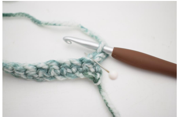
8. Hækl 1 fm i bml rækken ud. Den bagerste lænke er den lænke nålen her viser.