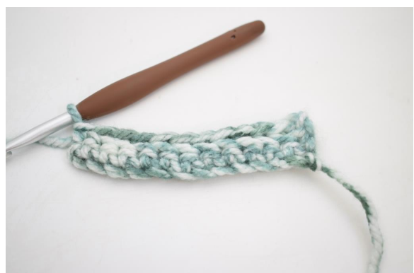
12. Hækl 1 fm i bml rækken ud. (43)