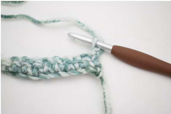
7. Vend med 1 lm.