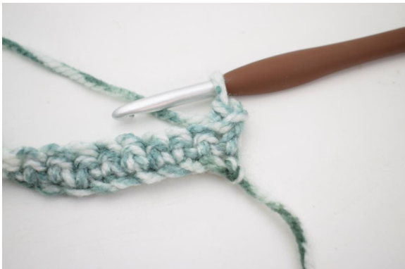
9. Sådan. Der er nu hæklet 1 fm i bml.