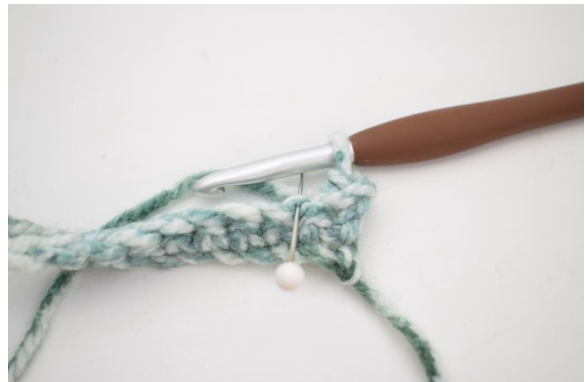
10. Hækl 1 fm i næste m i bml.