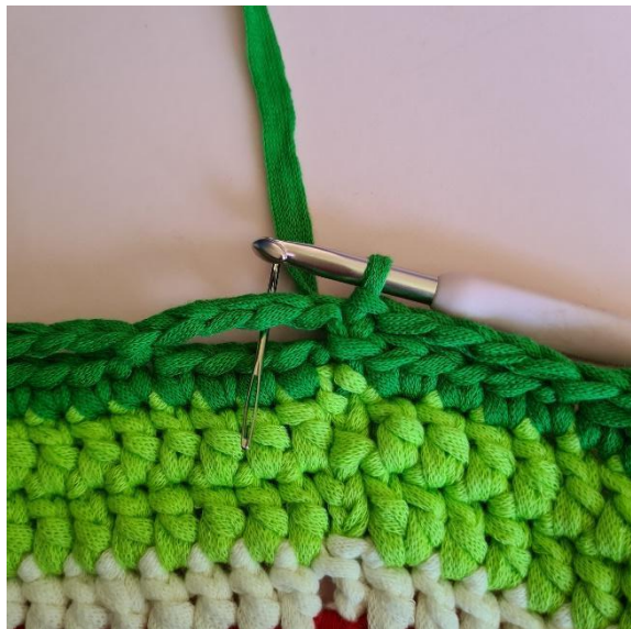
[3 fm, lm, 3 fm]