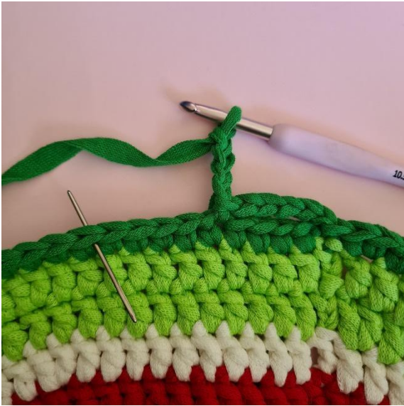
4 lm, spring over 4 m,