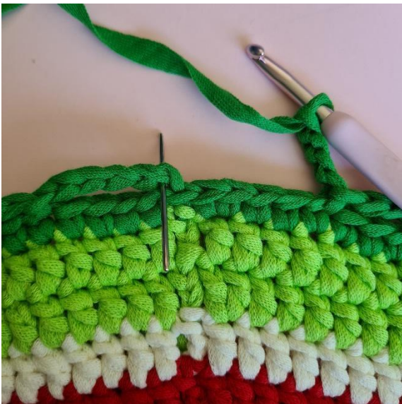
Afslut med 1 km i den første lm