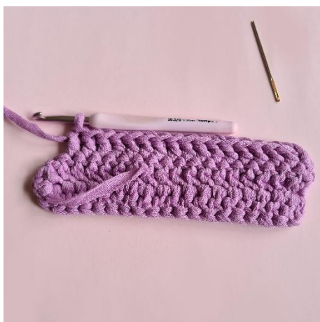
7. 16 stgm.