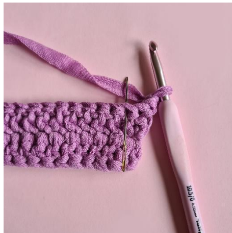
2 lm, spring over den første m