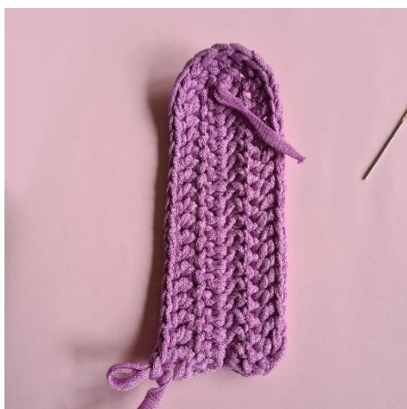
9. 16 stgm. 1 st i vlm. Vend