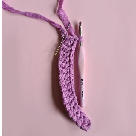
2. 16 stgm, 3 stgm i samme m