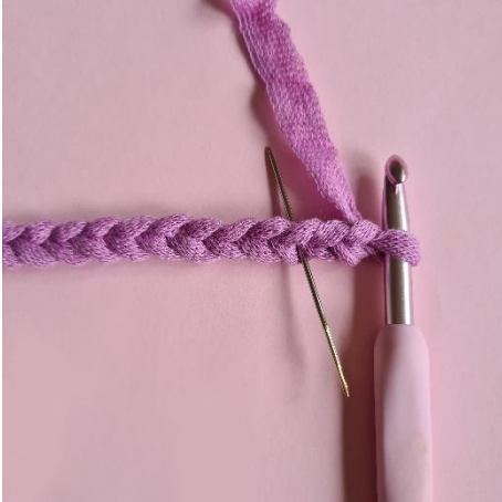
1. Lav 20 lm, start i 3. lm fra nålen