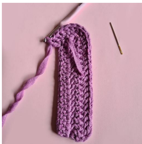
8. [udt] x5,