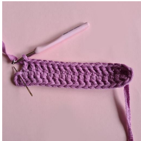
4. 2 stgm i sidste m.