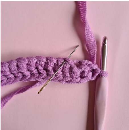
3. vend uden at vende arbejdet. 16 stgm.