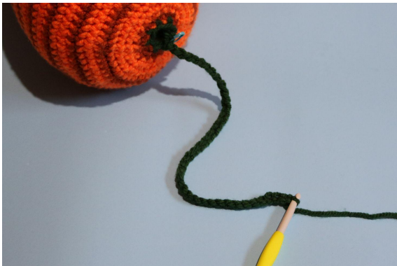
1. Blad A.) Fm i fml, slå 40 lm op