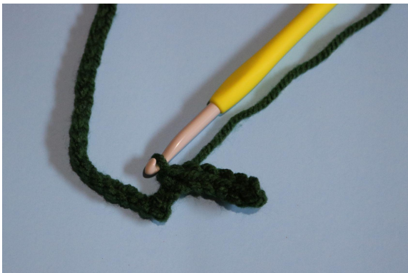
3. I den anden lm fra nålen lav 6 km