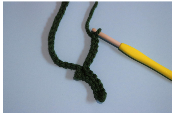
4. Km i næste lm, 7 lm, i den anden lm fra nålen lav 6 km