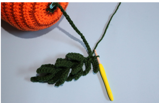
5. Gentag trin #8 18 gange (i alt 19 små blade) og lav km i de resterende 20 lm