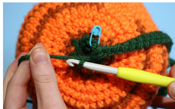
6. Km i fml i næste m, (start derefter blad B)