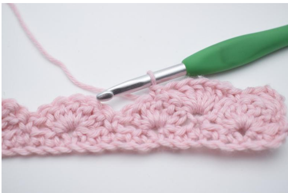
9. hækkl 1 fm i næste m.