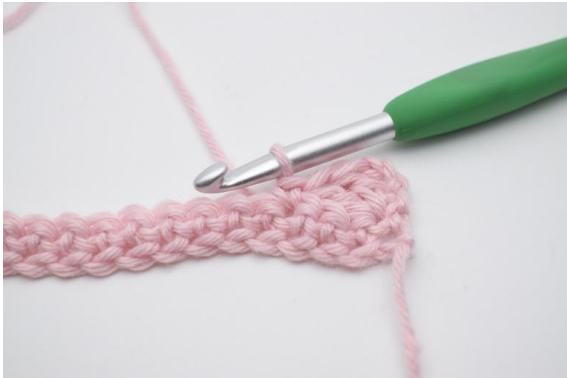
5. hækl 1 fm i næste m.