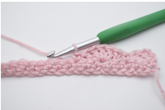
9. hækl 1 fm i næste m.