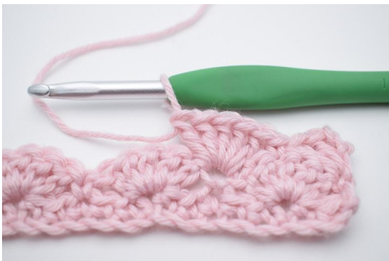
7. hækkl 5 stgm i næste m.