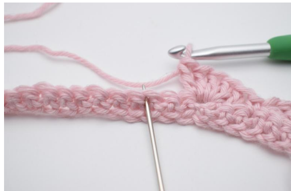
8. Spring 2 m over,