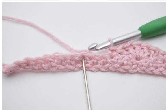
10. Spring 2 m over,