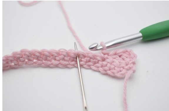
6. Spring 2 m over,