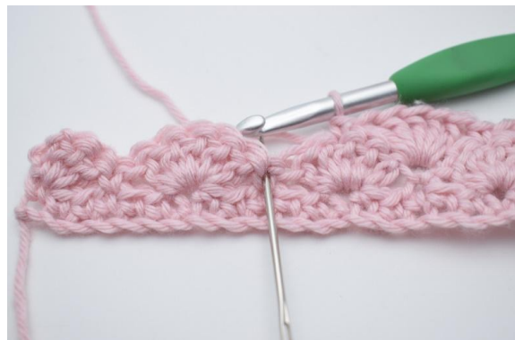
10. Spring 2 m over,