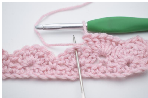
8. Spring 2 m over,