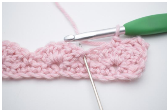
6. Spring 2 m over,