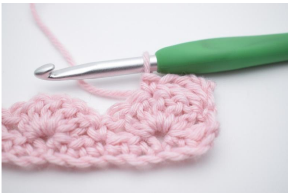
5. hækkl 1 fm i næste m.