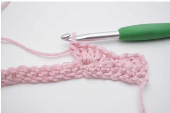
7. hækl 5 stgm i næste m.