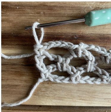
Billedet viser slutningen af Række 3.