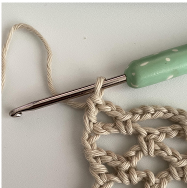
Billedet viser slutningen af Række 4.

Række 4: 6 LM. I den første LM-BUE, FM. *(5 LM, i næste LM-BUE, FM). GENT fra *( ) i alle LM-BUEr rækken hen. 2 LM, STGM i den 2. LM i 6-LM-kæden nedenfor. (21 Buer)