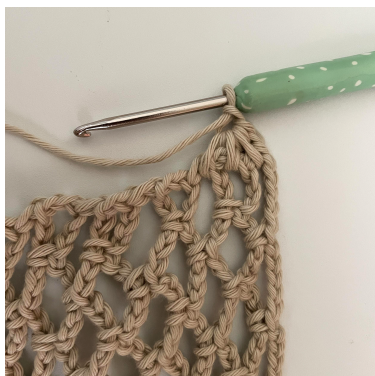
Billedet viser begyndelsen af Række 1.

Række 1 (RS): Du skal nu hækle ned ad siderne. Drej arbejdet 90 grader. Du skal nu hækle omkring hver bue. 1 LM, FM i første 5-LM-BUE *(3 HSTGM SM, 1 LM). GENT fra *( ) rækken hen. FM i sidste. VEND. (20 M)