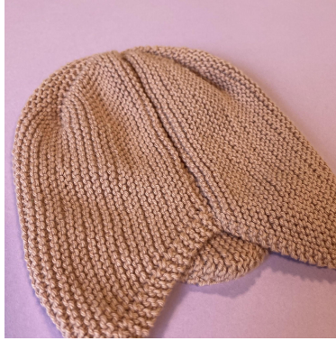
Sammensyning opslags- og aflukningskant