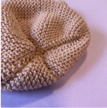
Sammensyning del 1-6