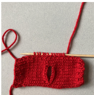
Opsamling af masker til ærme