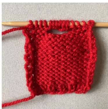
Opslag til hals på bagstykke