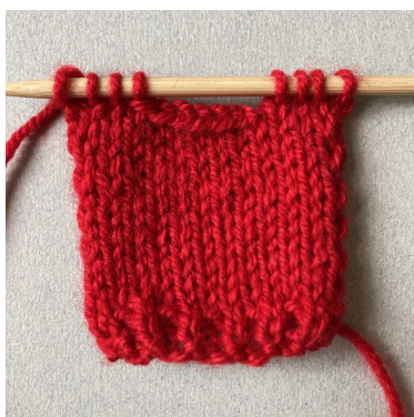
Aflukning af hals på forstykke

Luk af til hals: Strik 4 m, luk 6 m af, strik 4 m