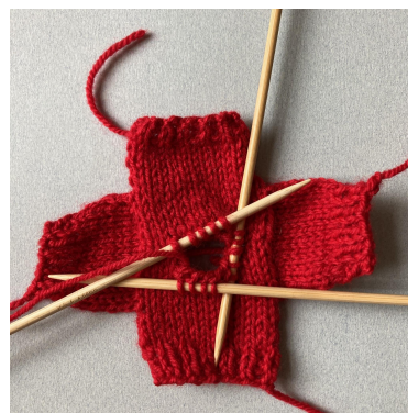
Opsamling til krave