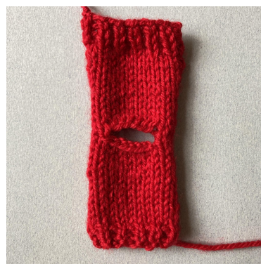
Færdigt for- og bagstykke