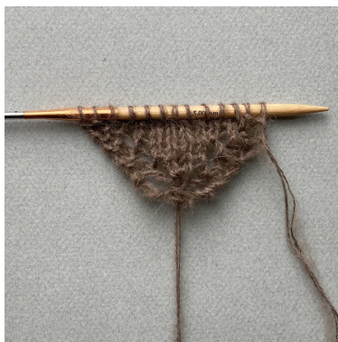
Begyndelse på bandana