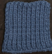
Cosy: Jeans Blue SBF: Jeans Blue