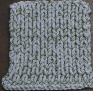
Cosy: Sky Blue SBF: Soft Green