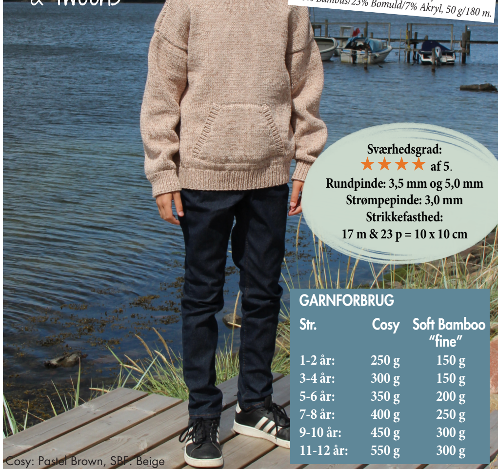
Cosy: Pastel Brown, SBF: Beige