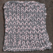
Cosy: Grey SBF: Light Pink