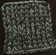
Cosy: Hunting Green SBF: Off White