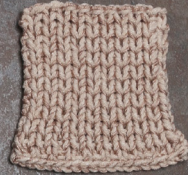
Cosy: Pastel Brown SBF: Nude Beige