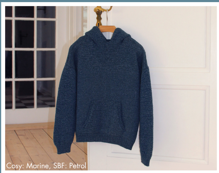
Cosy: Marine, SBF: Petrol

Nøglen til at strikke en bestemt størrelse, handler mere om strikkestilen end om størrelsen på pindene. Derfor anbefaler vi altid et spænd af pindestørrelser.