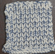
Cosy: Off White SBF: Jeans Blue