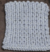
Cosy: Sky blue SBF: Light Grey