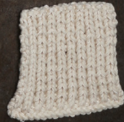
Cosy: Off White SBF: Off White