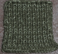
Cosy: Hunting Green SBF: Soft Green