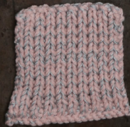
Cosy: Pastel Rose SBF: Light Grey