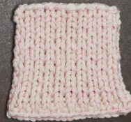
Cosy: Off White SBF: Light Pink