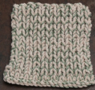
Cosy: Pastel Brown SBF: Soft Green