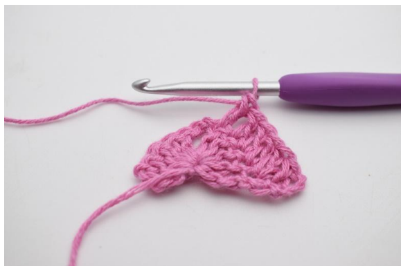
3. Hækl 1 stgm i de næste 4 m.