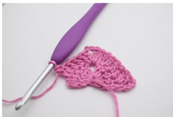
6. Hækl 1 stgm i de næste 4 m.