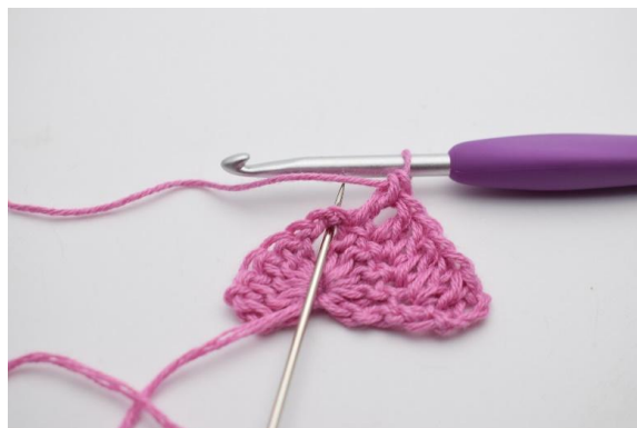
4. I lm-buen hækles 2 stgm, 2 lm, 2 stgm.