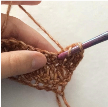
1. So, stik nålen i masken, der lige er lavet