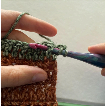
1. So, stik nålen ind bag omkring stgm