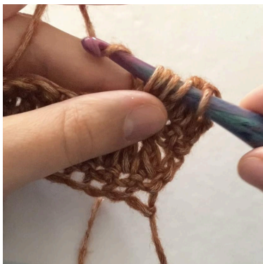
4. (5 løkker på nålen), So