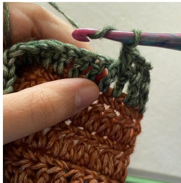
5. Så er der lavet en Frstgm!