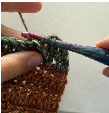
1. So, stik nålen ind foran omkring stgm.

Gentag billede 2-4 "Sådan laves en Frstgm"