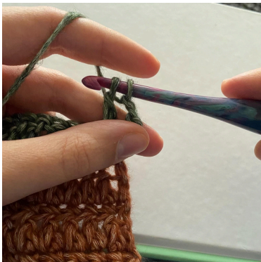
4. Træk igennem 2, So, træk igennem 2 igen