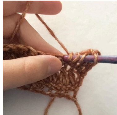
3. Stik nålen i den næste maske