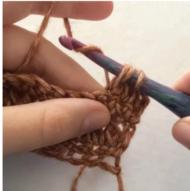
2. (3 løkker på nålen), So