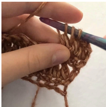
5. Træk igennem 3 løkker, So