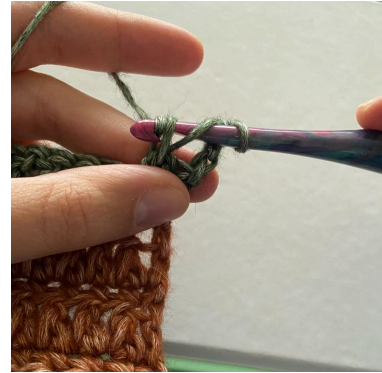
3. (3 løkker på nålen), So