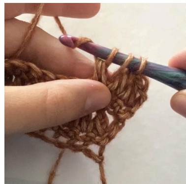
6. Træk igennem de næste 3 løkker