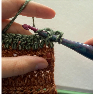
2. So, træk igennem