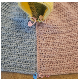
Sidste omgang på kroppen

Du bør ende med at have samlet 26(31, 34) (40, 46, 52, 56) km'er. Luk af.