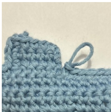
lav 1 fm i den sidste m før hjørnet