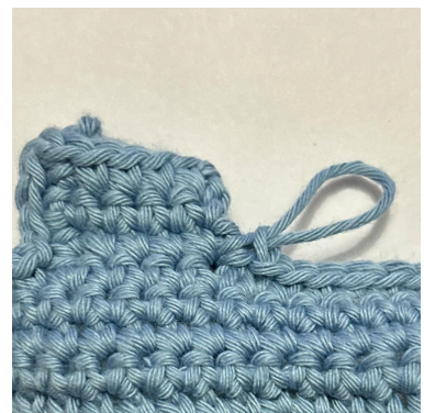
Og 1 fm i første række efter hjørnet