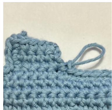
Og 1 fm i første række efter hjørnet