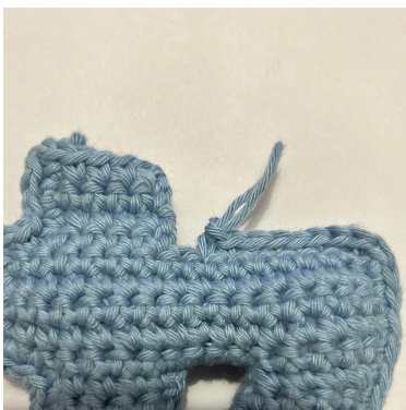
Når du har et hjørne som vender indad som her

Læg så hver del ovenpå hinanden med retsiden vendt udad mod dig selv. Nu hækles der igen. Lav 1 lm, og hæk så 1 fm i hver m og side af rækkerne hele vejen rundt, gennem begge hæklede lag, og fyld tallet undervejs. Afslut med 1 fm i den sidste m og lav en usynlig samling med omgangens første m. Hæft ender.