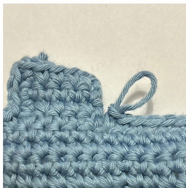
lav 1 fm i den sidste m før hjørnet