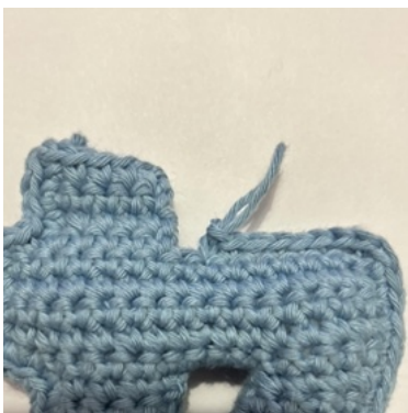
Når du har et hjørne som vender indad som her

Læg så hver del ovenpå hinanden med retsiden vendt udad mod dig selv. Nu hækles der igen. Lav 1 lm, og hæk så 1 fm i hver m og side af rækkerne hele vejen rundt, gennem begge hæklede lag, og fyld tallet undervejs. Afslut med 1 fm i den sidste m og lav en usynlig samling med omgangens første m. Hæft ender.