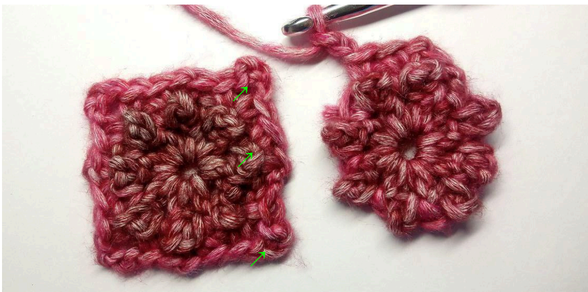
Firkant A (til venstre) Firkant B (til højre)

Hækl de næste 2 (3) firkanter sammen i en række efterhånden som de bliver færdige. For at gøre dette gentages Omg 1-2 til hver af de næste firkanter og du fortsætter med Omg 3 på denne måde: 1 lm (tæller ikke som en m), (1 fm, 1 lm, 1 fm) i næste 1lm-bue, (1 fm, 2 lm) i næste 1lm-bue, 1 fm i 3lm-buen i hjørnet på Firkant A (hold firkanterne med vrangsiden imod hinanden, indsæt nålen fra bagsiden mod forsiden når du hæklér i Firkant A), tilbage til Firkant B og lav 1 fm i samme 1m-bue som forrige fm, 1 fm i næste 1lm-bue, 1 fm i modsatte 1lm-bue på Firkant A, tilbage til Firkant B og lav 1 fm i samme 1lm-bue som forrige fm, 1 fm i næste 1lm-bue, 1 fm i modsatte 3lm-bue i hjørnet på Firkant A, 2 lm, tilbage til Firkant B og lav 1 fm i samme 1lm-bue som forrige fm, *(1 fm, 1 lm, 1 fm) i næste 1lm-bue, (1 fm, 3 lm, 1 fm) i næste 1lm-bue* 2 gange, saml med 1 km i første fm. Bryd garnet og hæft ende.