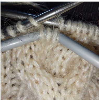
Sno x m foran