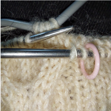
Sno x m bagom